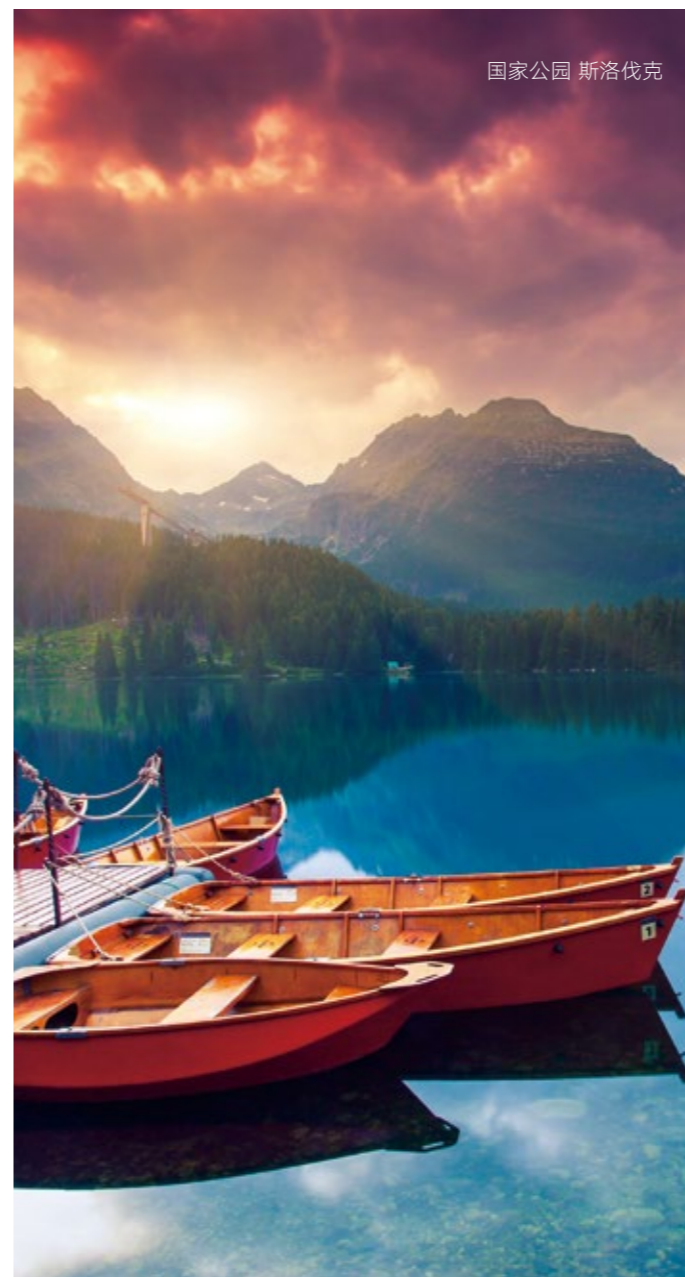
国家公园 斯洛伐克