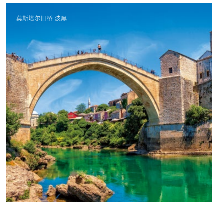
莫斯塔尔老桥 波黑