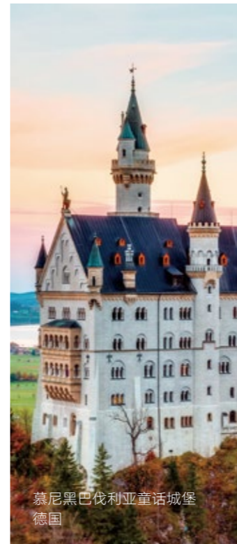
慕尼黑巴伐利亚童话城堡 德国

武契奇还提到，应该改革塞尔维亚的教育体系，他说：“塞尔维亚应该改革教育体系，不但要培养更多的专家，还要培养专业工人，以便直接进入现代化工厂工作。”