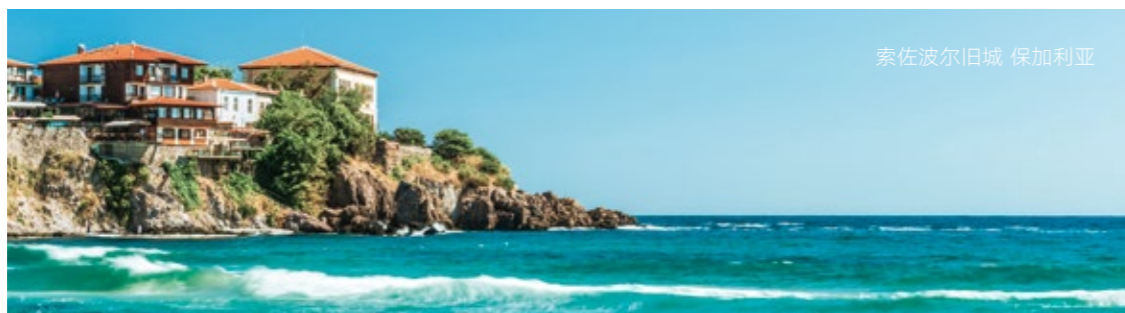
索佐波尔旧城 保加利亚

有经济学家表示，保加利亚不需要新建发电厂。如果该核电站建成，将有两个1000兆瓦的反应堆。虽然它最初被视为替代老化的 Kozloduy 核电站，但2016年1月，Kozloduy 核电站签署了一项合同，将其所剩两个反应堆的寿命延长至2049年。