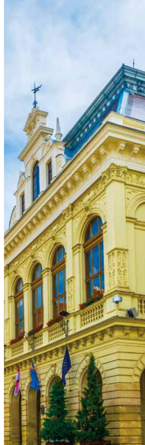
匈牙利 索普朗市政厅

中匈贸易关系继续改善，这证明了“向东开放”政策的正确性。2016年，匈牙利对中国的出口额和进口额都在上升，两国双边贸易额同比增长8%以上。今年前五个月，双边贸易额的同比增长率到达12.78%。2016年，匈牙利对华出口增长率超过25%，而今年1月至5月的出口额同比增长32%。2016年，匈牙利与中国的贸易逆差缩小了12%。