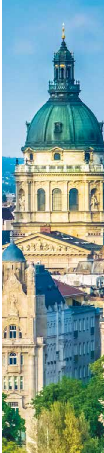
匈牙利 圣·伊斯特万大教堂