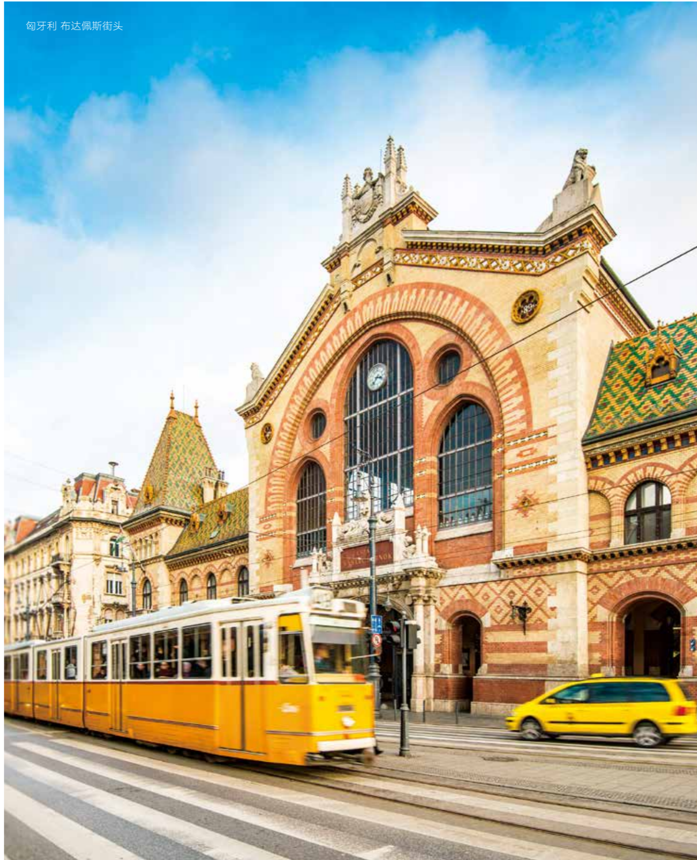
匈牙利 布达佩斯街头

我国政府预测的增长率比欧盟委员会预计的更高：在《融合计划》中，我们预测今年 GDP 将增长 4.1%，明年增长 4.3%。今年第一季度，GDP 同比增长了 4.2%，这证实了我们乐观的预期。