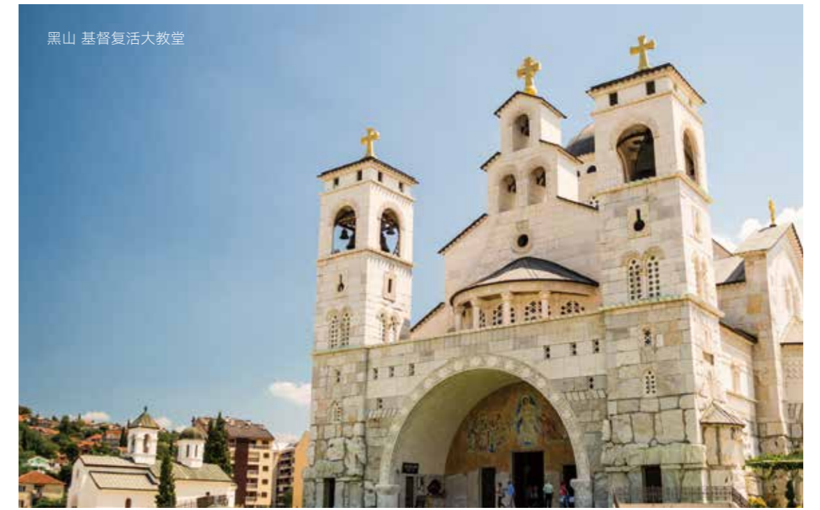
黑山 基督复活大教堂

但实际上，Warsz 是一名生活在 12 至 13 世纪的贵族，其领地即位于今天华沙老城“Mariensztat”地区。