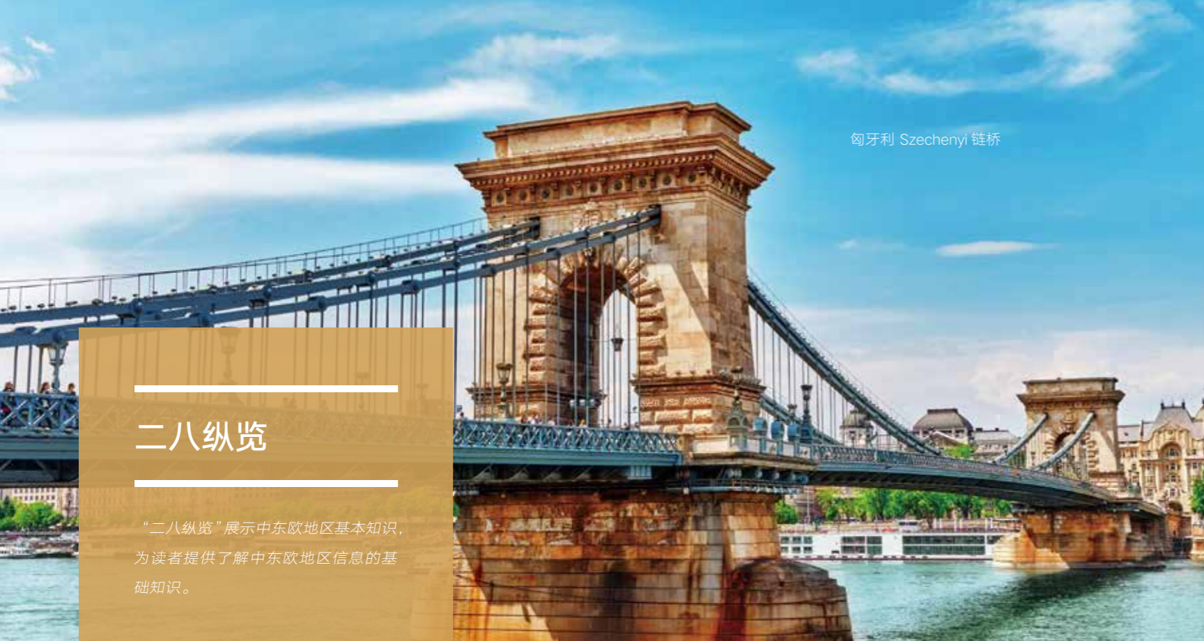
匈牙利 Szechenyi 链桥