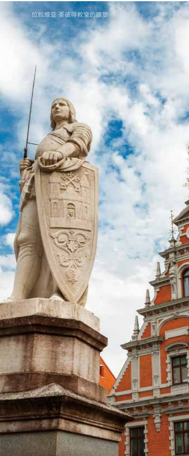
拉脱维亚 圣彼得教堂的雕塑