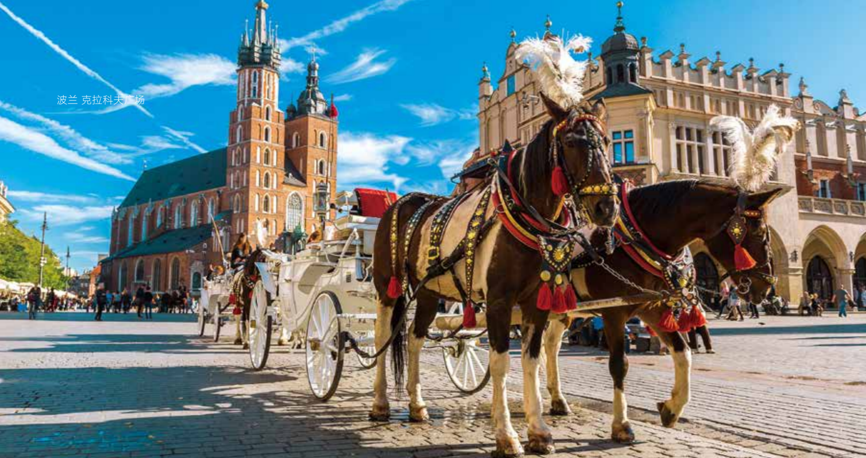
波兰 克拉科夫广场