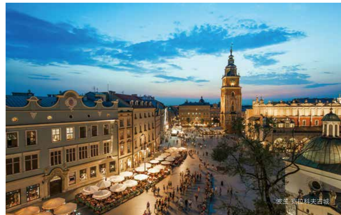
波兰 克拉科夫古城

卡钦斯基和图斯克之间的不和与冲突并未表现出缓和的迹象。波兰政府曾反对图斯克连任欧盟理事会主席，不过未能阻挡他连任。图斯克新任期将到2019年届满。到那时，他可以再次在波兰竞选，并让卡钦斯基更清楚地认清形势。