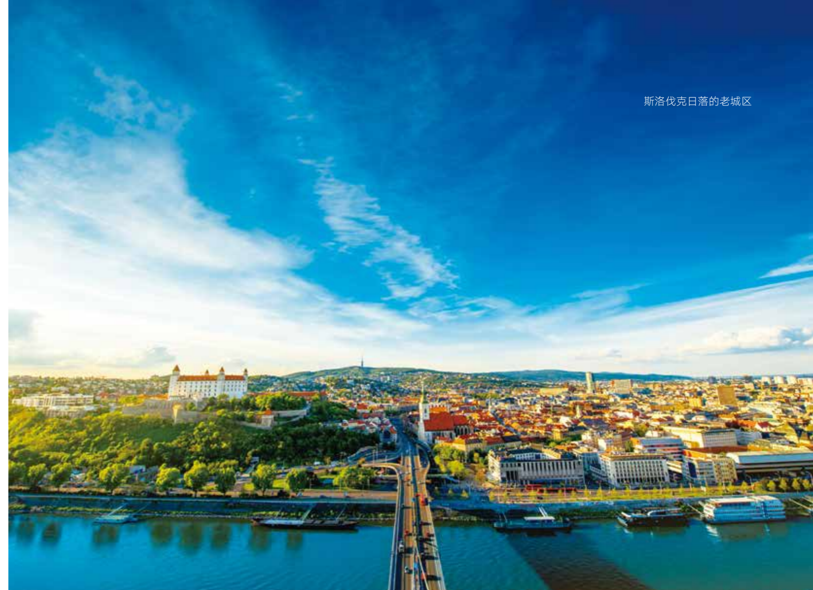
斯洛伐克日落的老城区