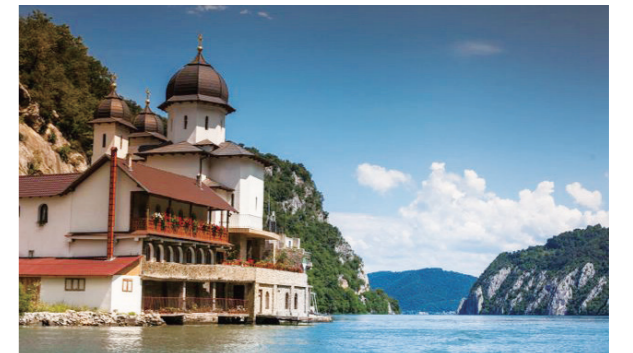
图 5：罗马尼亚铁门国家公园的修道院

多瑙河的三分之一蜿蜒穿过罗马尼亚，其中有不少难以行船的河段。在罗马尼亚的旧摩尔多瓦市 (Moldova Veche) 以东，河面变得宽阔，形成海湾，但马上又进入狭窄的峡谷。该峡谷将喀尔巴阡山脉与塞尔维亚的巴尔干山脉分开。