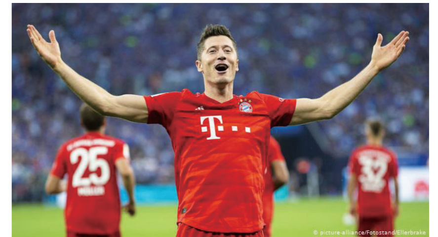
图 1：罗伯特·莱万多夫斯基 13

8 月 23 日，在欧洲冠军杯决赛中，拜仁慕尼黑足球队以 1-0 战胜巴黎圣日耳曼队，以 11 连胜的绝佳战绩无可争议地夺得了本届欧冠的冠军。拜仁慕尼黑成为历史上第一支在欧冠单赛季取得全胜的球队。而力挺拜仁队取得如此佳绩的球员中，有一位来自波兰的前锋、波兰国家足球队队长——罗伯特·莱万多夫斯基 (Robert Lewandowski)。