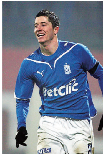
图 2: 在波兹南莱克俱乐部效力的莱万多夫斯基 18