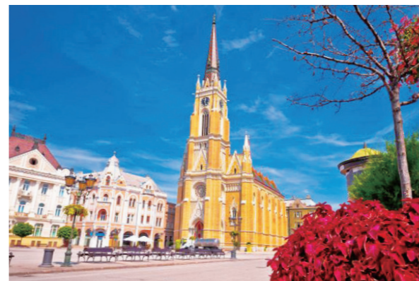
图 4：塞尔维亚诺维萨德的自由广场和天主教大教堂

塞尔维亚的第二大城市诺维萨德距离首都贝尔格莱德不足 80 公里，其虽拥有首都的历史和都市风情，但却没有熙熙攘攘的喧嚣。此城有一座彼得罗瓦拉丁要塞 (Petrovaradin Fortress)，其脚下是历经沧桑的老城，那里有博物馆、纪念碑、餐厅和商店。