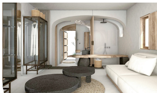
图 2: 圣托里尼的丽笙酒店 (2)

该酒店名为“Radisson Blu Zaffron Resort”，位于圣托里尼岛东南的海滨村庄卡马里 (Kamari)。此外，丽笙酒店集团还在雅典和克里特岛上经营酒店。