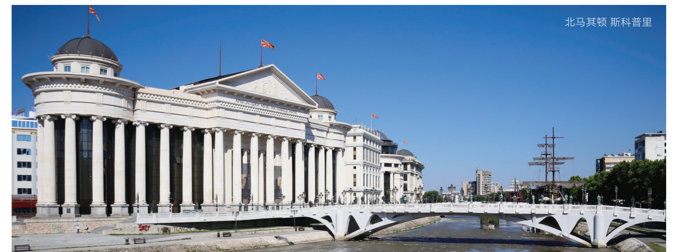
北马其顿 斯科普里

摩尔多瓦将获得 1 亿欧元的宏观金融援助，以用于加强公共财政管理、反腐败以及改善商业环境等领域。