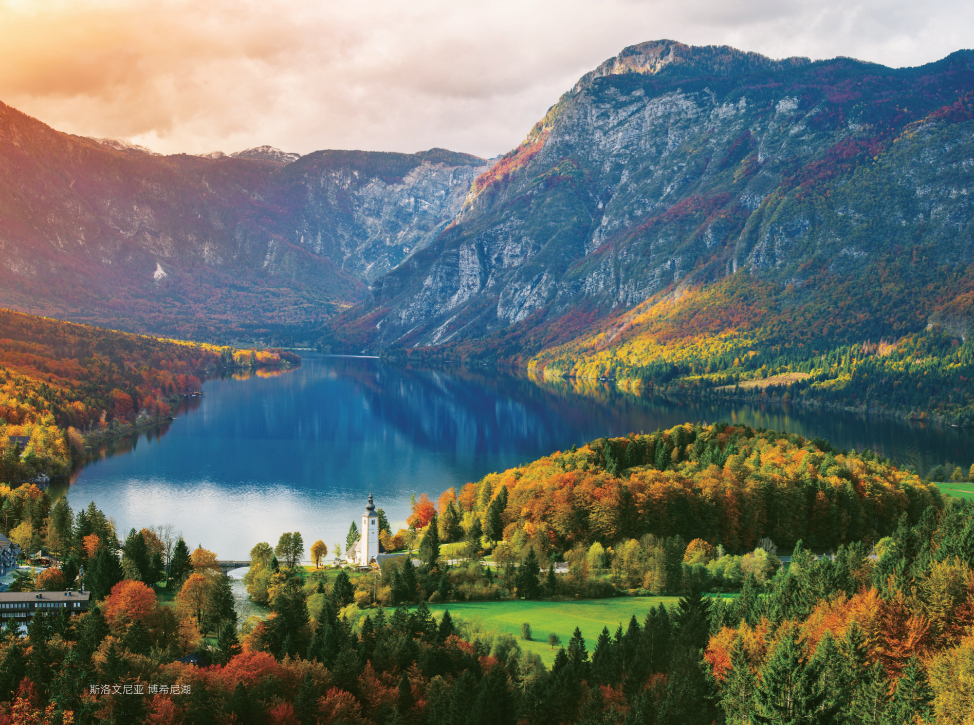
斯洛文尼亚 博希尼湖