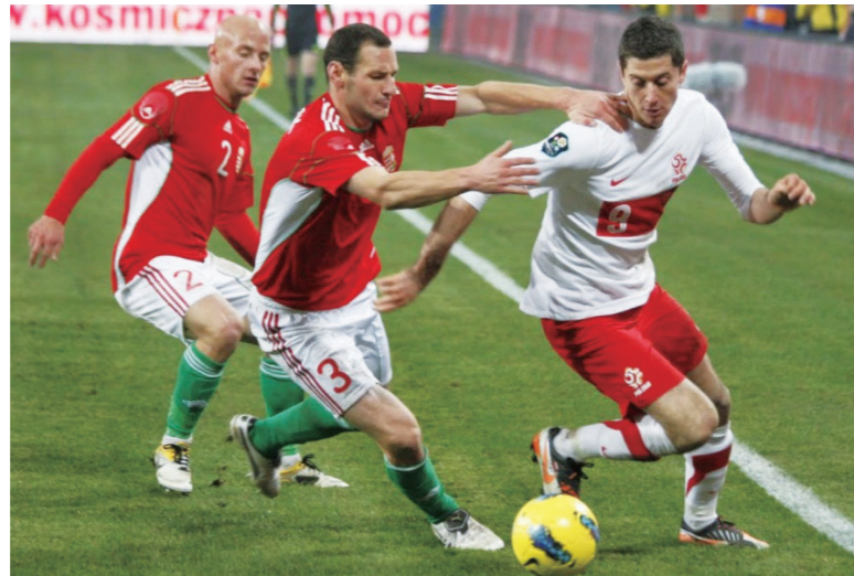
图 3: 为波兰国家队效力 19

2008 年，他在 20 岁生日后三周，在波兰队对阵圣马力诺的比赛中替补出场，这是他首次代表国家队上场比赛。不到 10 分钟之后，他接到队友的助攻后打进其在国家队的第一粒进球 20 。