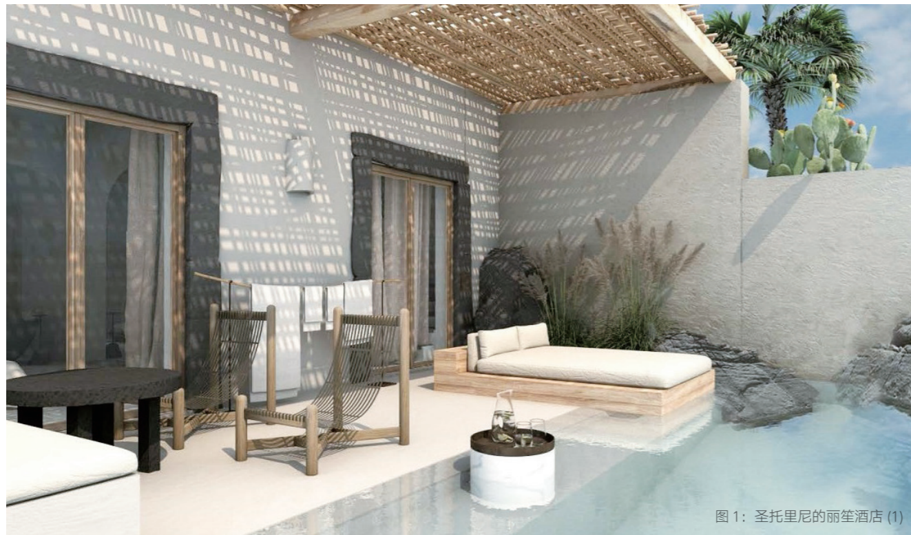
图 1: 圣托里尼的丽笙酒店 (1)