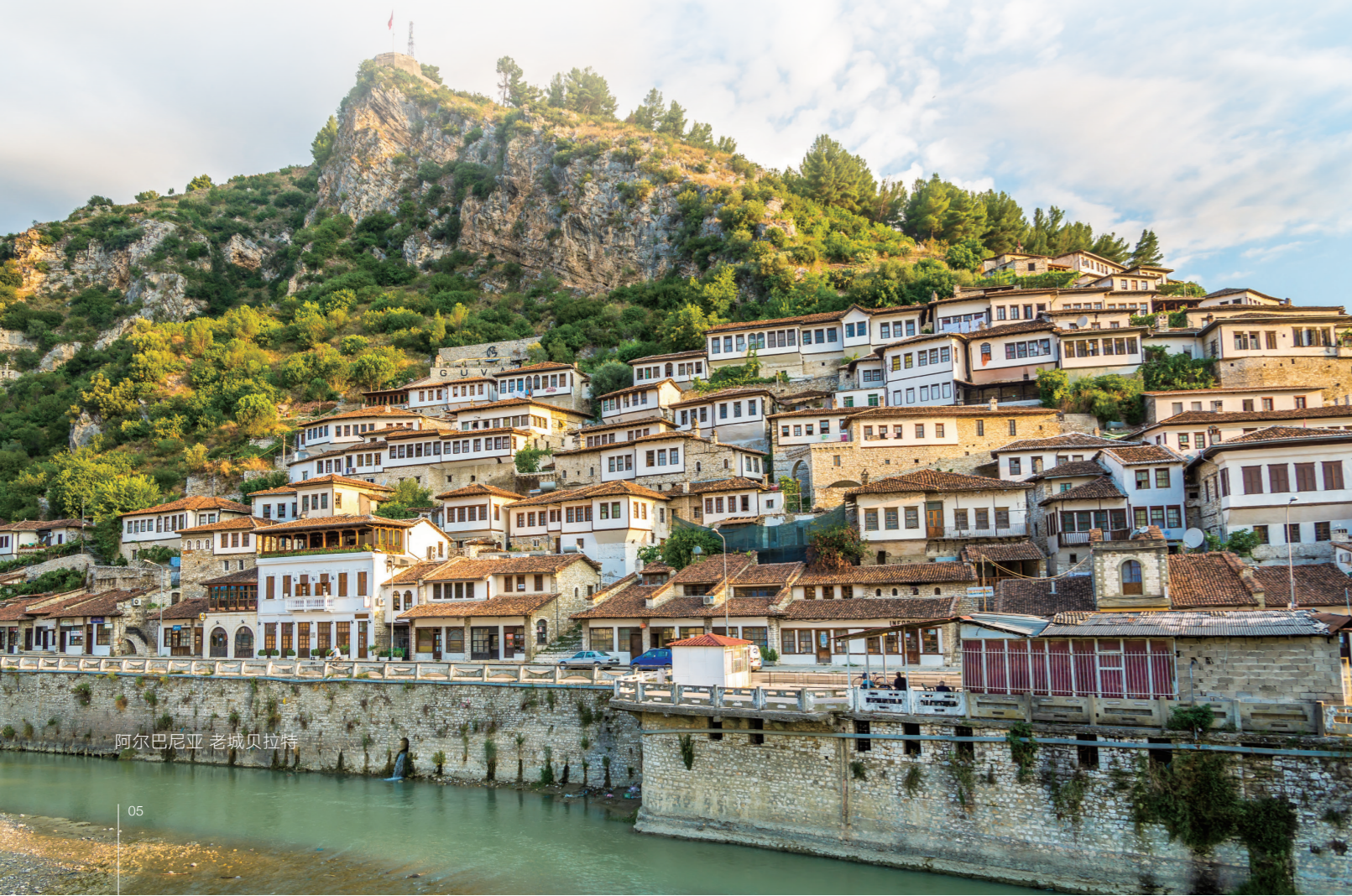
阿尔巴尼亚 老城贝拉特

为缓解自二战以来最严重的经济下滑，欧洲各国政府同意采取一系列特殊措施以恢复其经济，其中包括设立7500亿欧元的欧盟复苏基金 (the EU Recovery Fund)。这项应急基金将向成员国发放其中的3900亿欧元（其余资金为低利率长期贷款），主要用于支持各国基础设施和“绿色能源”项目。此外，欧盟复苏基金将通过债务共同化来实施：这将是欧盟历史上首次以超国家实体身份借贷资金，并将其用于欧洲共同建设。由此，东南欧（希腊、西巴尔干地区）将成为欧盟复苏基金和欧盟2021-2027预算的主要受益者，原因在于上述两项对东南欧的资金分配规模、时机以及对经济的强大乘数效应。