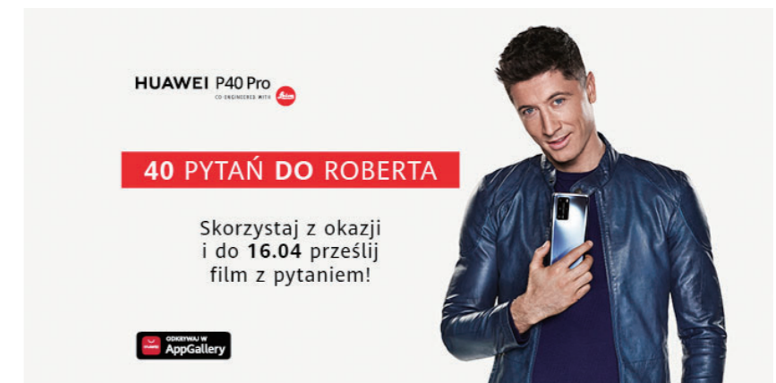
图 6: 莱万多夫斯基是华为的品牌大使 25

另外，早在 2015 年秋季，莱万多夫斯基就成为华为在中东欧及北欧地区的品牌代言人 24 。最近，这位出色的运动员手握最新款华为 P40 系列手机的宣传照，出现在华沙、布拉格和欧洲其他城市的主要街道。