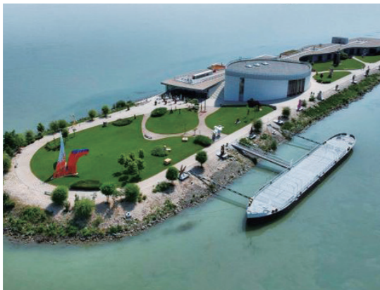
图 1：布拉迪斯拉发多瑙河上的艺术博物馆

布拉迪斯拉发以其古怪的街边雕塑和山顶城堡而成为游客的最爱，但鲜为人知的是，这座城市有一座时尚的现代艺术博物馆，位于布拉迪斯拉发下游、多瑙河的一个人工岛上。