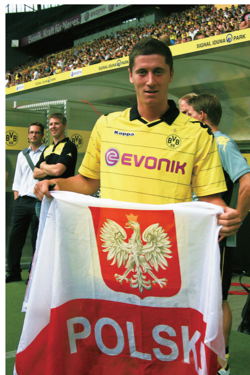
图 4: 加入多特蒙德俱乐部的莱万多夫斯基 21