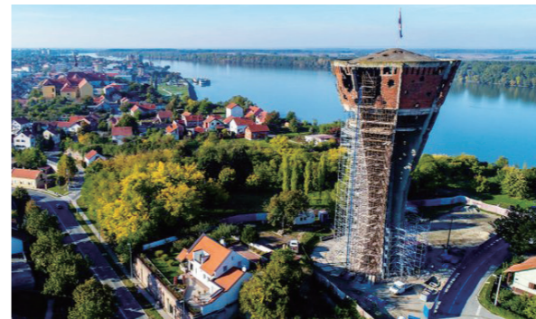
图 3：克罗地亚武科瓦尔

克罗地亚小城武科瓦尔 (Vukovar)，曾经是一座巴洛克风格的小镇，然而却在 1991 年的战争中遭到破坏，距今已近三十年。这座受损严重的水塔是在提醒人们记住那场残酷的战争，当时这座城市遭受围困长达 87 天。