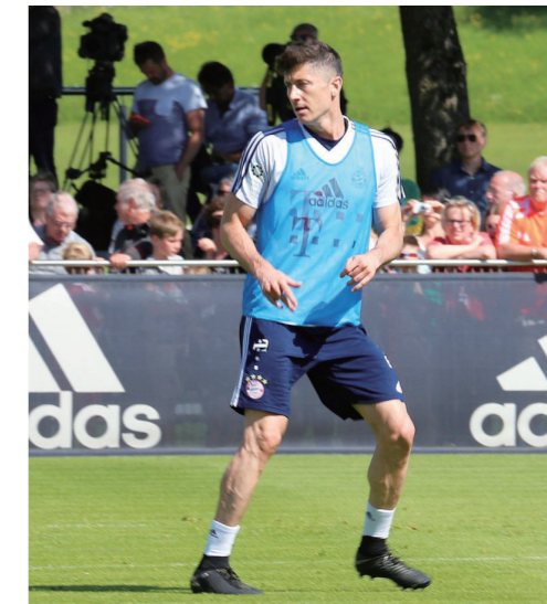
图 5: 加入多特蒙德俱乐部的莱万多夫斯基 22