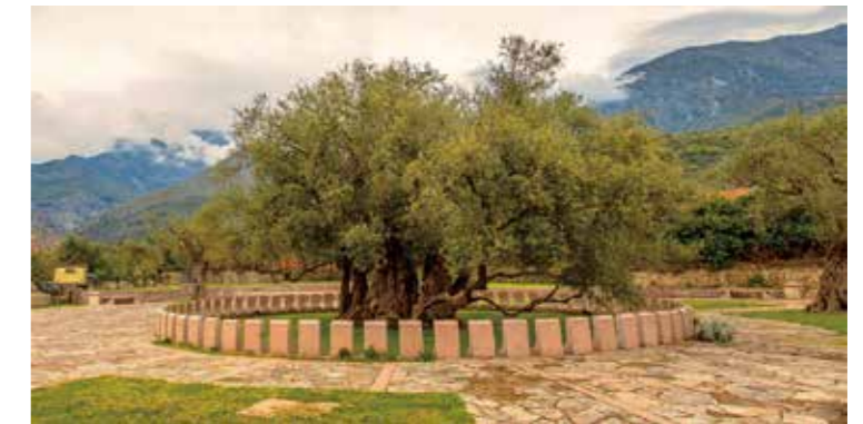
图 4：换个角度看看这棵树 15

这棵橄榄树的胸径达到 9.144 米。在它 2000 多年的历史中，它曾经遭遇过雷击、火灾的侵扰。由于雷击，一部分树干不幸被完全烧毁；根据当地流行的民间说法，曾经有几个人在树旁玩纸牌时，一个人把一盏点燃的灯挂在树上，这让老橄榄树起火，幸好火很快就被扑灭了。1957 年，政府为老橄榄树树立了纪念碑，并把它保护起来。