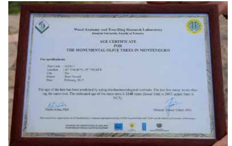
图 3：老橄榄树获得的树龄证书 14