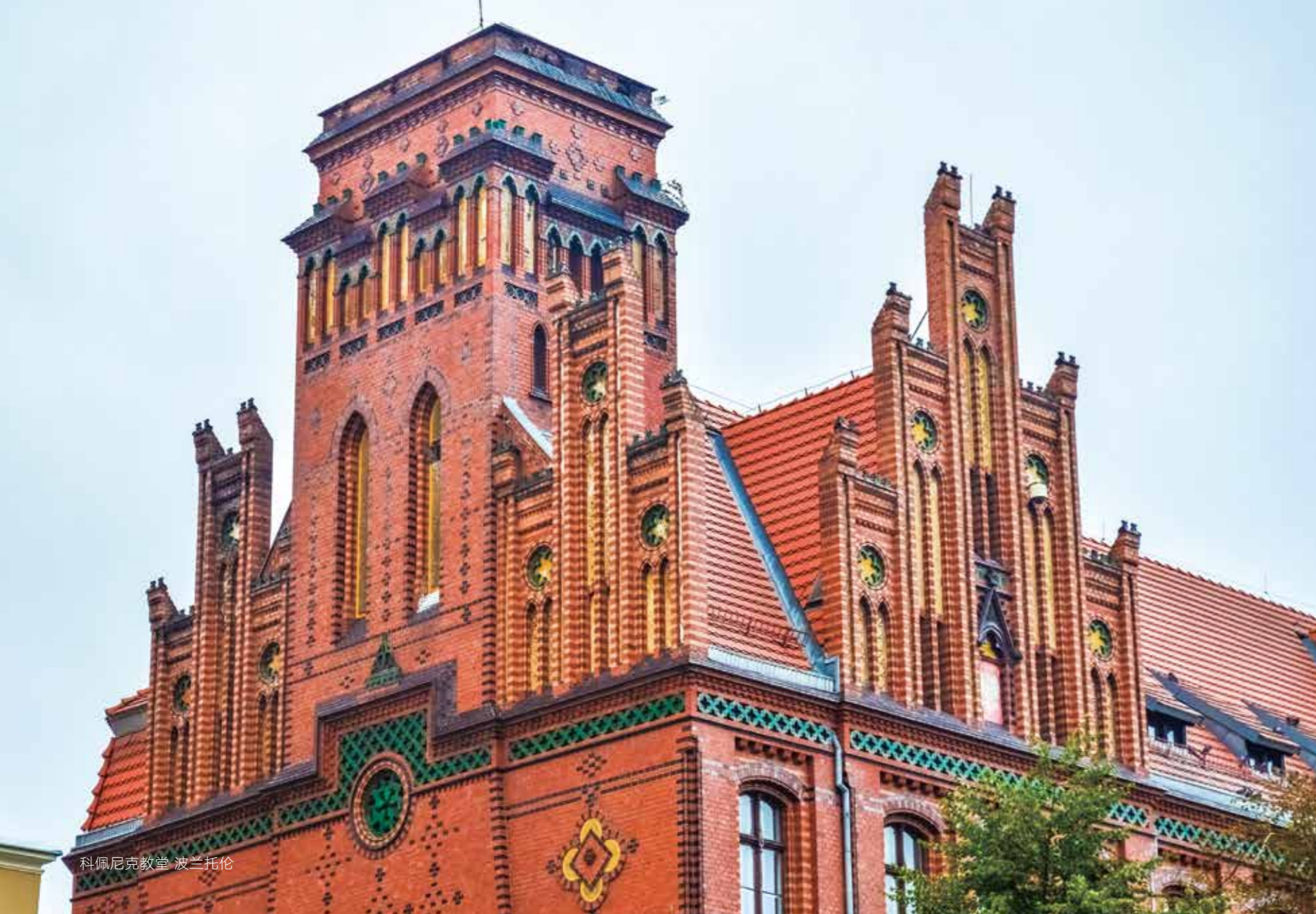
科佩尼克教堂 波兰托伦