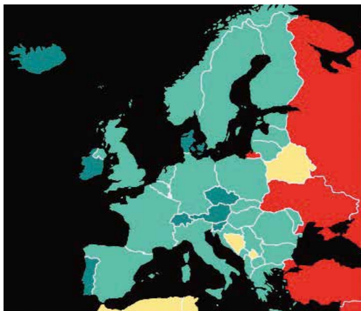
注: 表示和平程度的颜色从高到低依次是: 红色、黄色、绿色、深绿色。

国际经济与和平研究所 (International Institute For Economics and Peace) 是一家独立智库,旨在关注世界和平与稳定,它发布的最新全球和平指数 (Global Peace Index) 显示: 去年世界的和平程度略有提高。