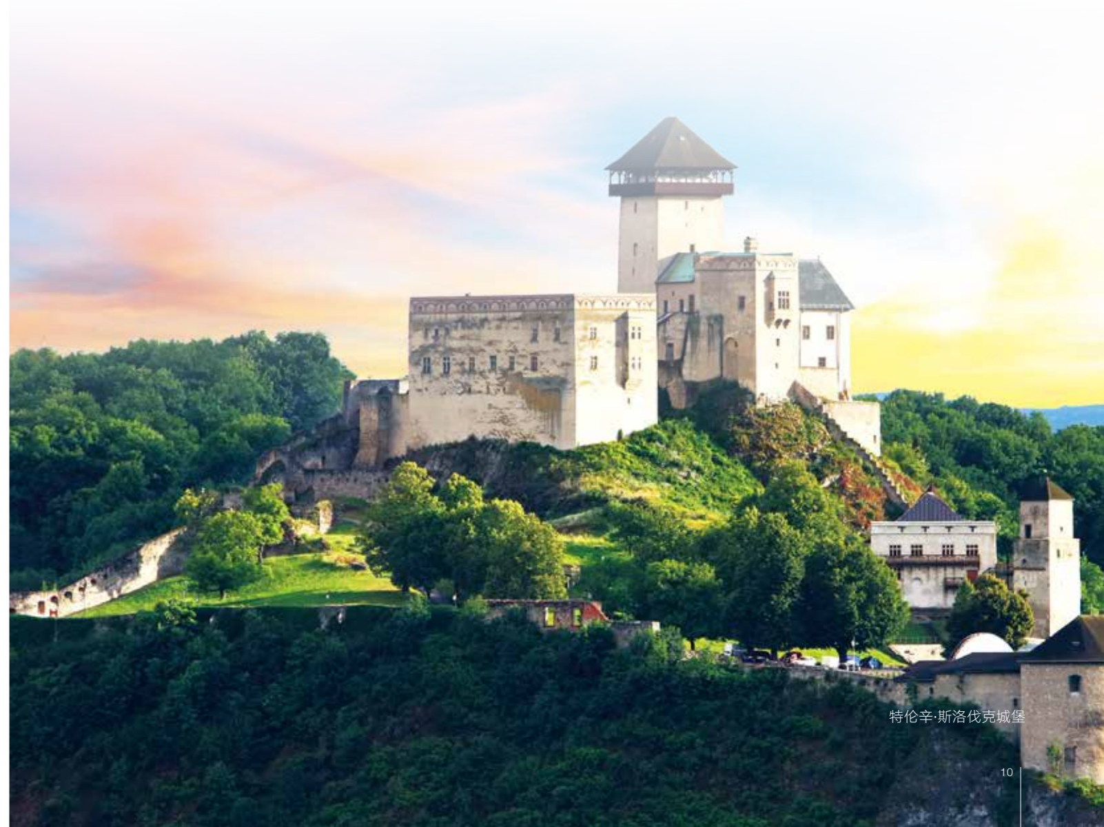
特伦辛·斯洛伐克城堡

该协议规定了中国和斯洛伐克的学生必须满足哪些要求才能被对方国家大学录取。它还规定了学生可以在斯洛伐克和中国获得的大学文凭和证书。