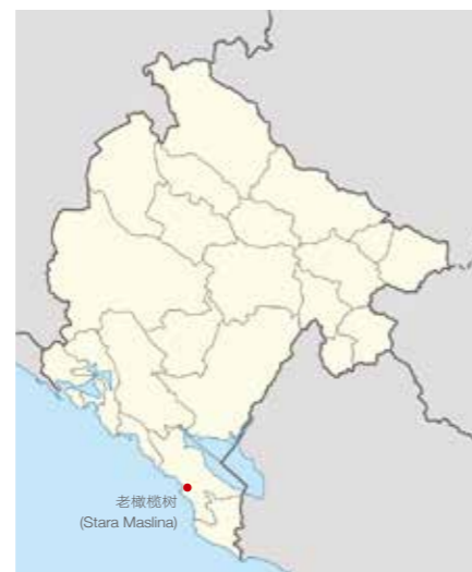
图 2：老橄榄树在黑山的位置 13

“老橄榄树”位于黑山南部巴尔（Bar）小城以东大约 5 公里的地方。根据土耳其伊斯坦布尔大学学者于 2015 年所做的测试，这棵树的树龄当年已经至少 2007 年、至多 2473 年，所以说它是世界上最古老的橄榄树 12 。目前，这里已经成为一个颇受欢迎的旅游胜地。