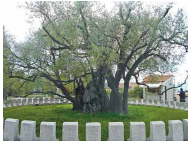
图 1：黑山的老橄榄树 11

说起欧洲最古老的事物，一般人们会想到希腊、意大利、德国、法国、英国等古老国家。实际上，在欧洲最年轻的国家——黑山，也有欧洲最古老的事物，那就是黑山的“老橄榄树”（黑山语：Stara Maslina）。