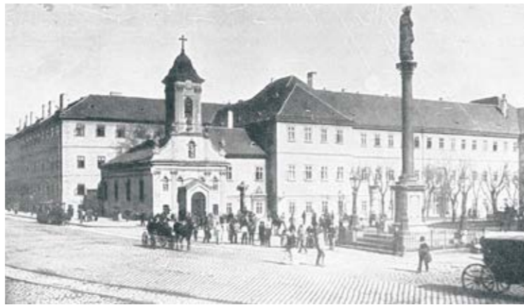
图3：19世纪末位于布达佩斯的 San Rocco 医院 20

1849年3月，塞梅尔维斯在维也纳总医院妇产科首席医师的任期结束。由于1848年匈牙利爆发了反对皇权的革命，致使身为匈牙利人的塞梅尔维斯受到牵连，因此该医院没有继续聘用他，甚至还降了他的职。1850年，他忍受不了这样的屈辱，回到了故乡布达佩斯。在故乡，他进入圣罗科医院 (San Rocco) 工作，采用同样的方法，大大降低了新的产褥热病例。1861年，他撰写了专著，分析产褥热的病因和治疗方法。不幸的是，当时的科学界极力反对他，使他受到了巨大的精神打击，最终被送进了精神病院治疗。1865年，他不幸去世，死于手术中感染的败血症，年仅47岁 19 。