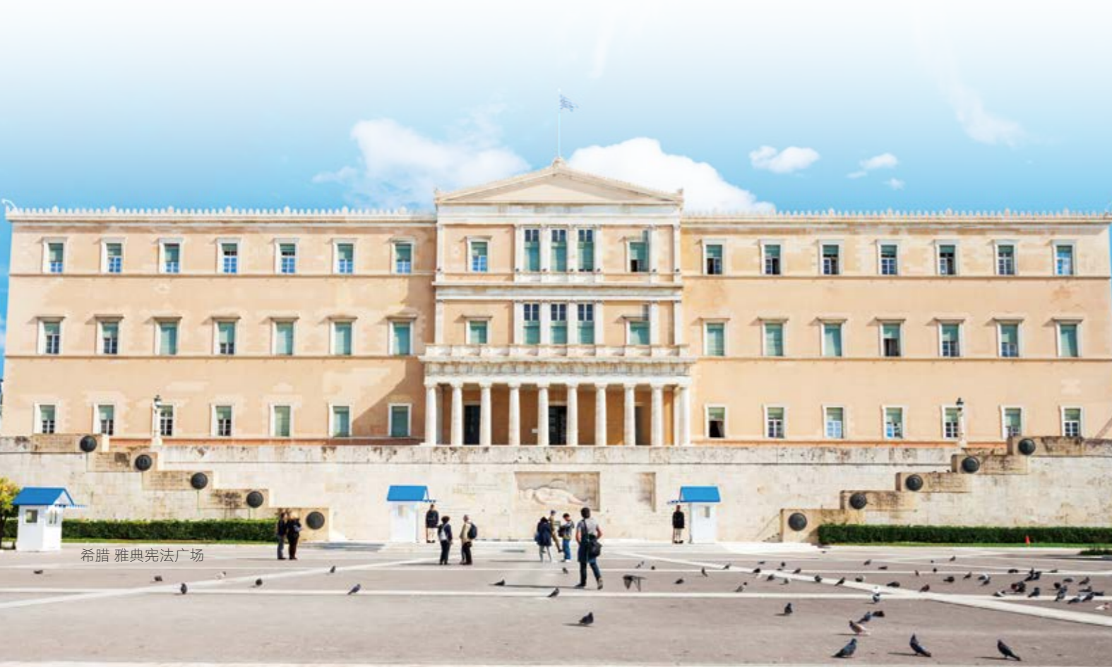
希腊 雅典宪法广场

根据希腊央行的数据，2019年20%的外国直接投资与希腊的私有化项目有关。在希腊进一步提升国有资产私有化程度的背景下，希腊央行预计，私有化将继续在吸引外国投资方面发挥重要作用。