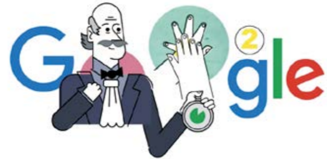
图 1：2020 年 3 月 20 日 Google 网站主页关于塞麦尔维斯的涂鸦作品 13

在新冠病毒疫情全球蔓延的背景下，Google 网站于 2020 年 3 月 20 日在其主页发布了一份涂鸦：