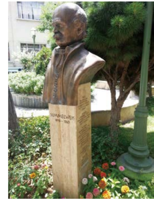
图5：位于伊朗德黑兰大学的塞梅尔维斯雕像 23