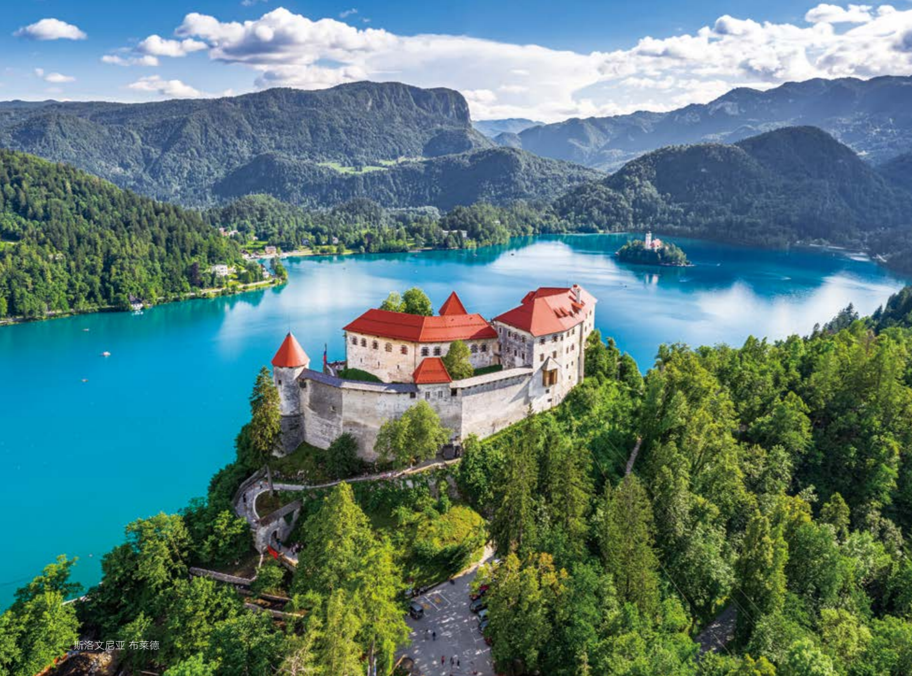
斯洛文尼亚 布莱德