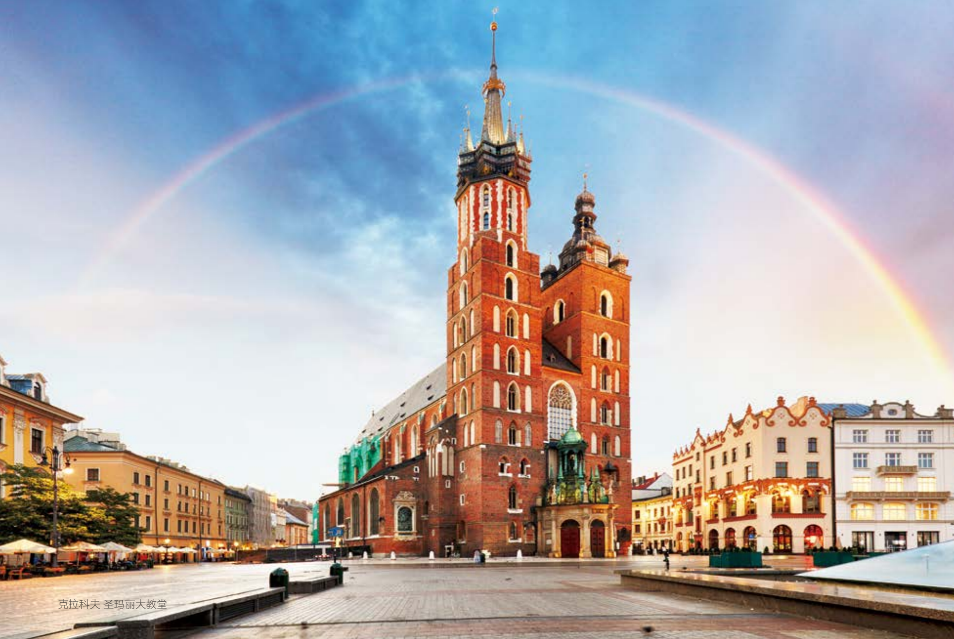
克拉科夫 圣玛丽大教堂