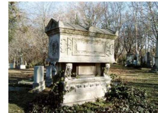
图6：他的墓地位于布达佩斯 Kerepesi 公墓 24

如果您下次去布达佩斯，那么希望您有空去那家以他名字命名的医学史博物馆看看，再次认识洗手对于预防和控制疾病的重要作用。