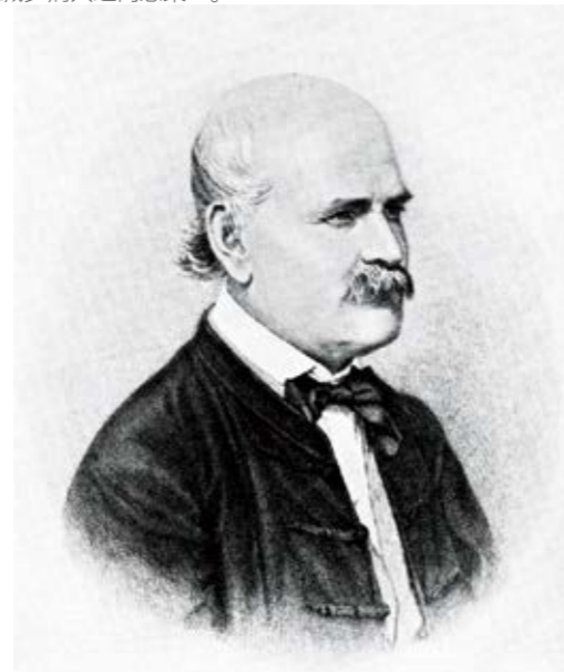
图 2：塞麦尔维斯医生的画像 15

他叫塞麦尔维斯·伊格纳兹 (Semmelweis Ignác)，是一位来自匈牙利的医生。1847 年 3 月 20 日，塞麦尔维斯被任命为维也纳总医院 (Vienna General Hospital) 妇产科首席医师。就是在这里，他认识到了洗手的重要性，认为定期洗手的医务人员可以减少病人之间感染 14 。