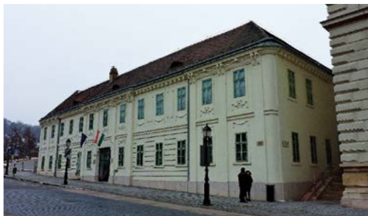
图4：位于布达佩斯的塞梅尔维斯医学史博物馆 22

如今，他的声誉得到了恢复，尤其他强调医生应保持卫生和洗手，为医疗卫生行业做出了巨大贡献。有人称他为“控制感染之父”。如今在布达佩斯，就在他父亲曾经经营的贸易公司所在地，有一座以他的名字命名的医疗博物馆，名叫“塞梅尔维斯医学史博物馆” (Simmelweis Orvostörténeti Múzeum) 21 ：