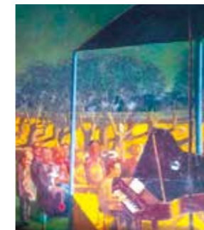
画家的儿子参加音乐会