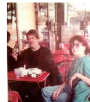
画家和妻子在华盛顿访问时的照片，其中画家喝的不是饮料，而是红酒