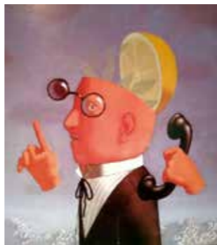
具有超现实主义风格的画