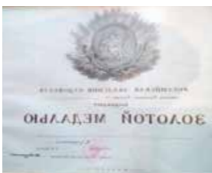
画家获得的俄罗斯大奖