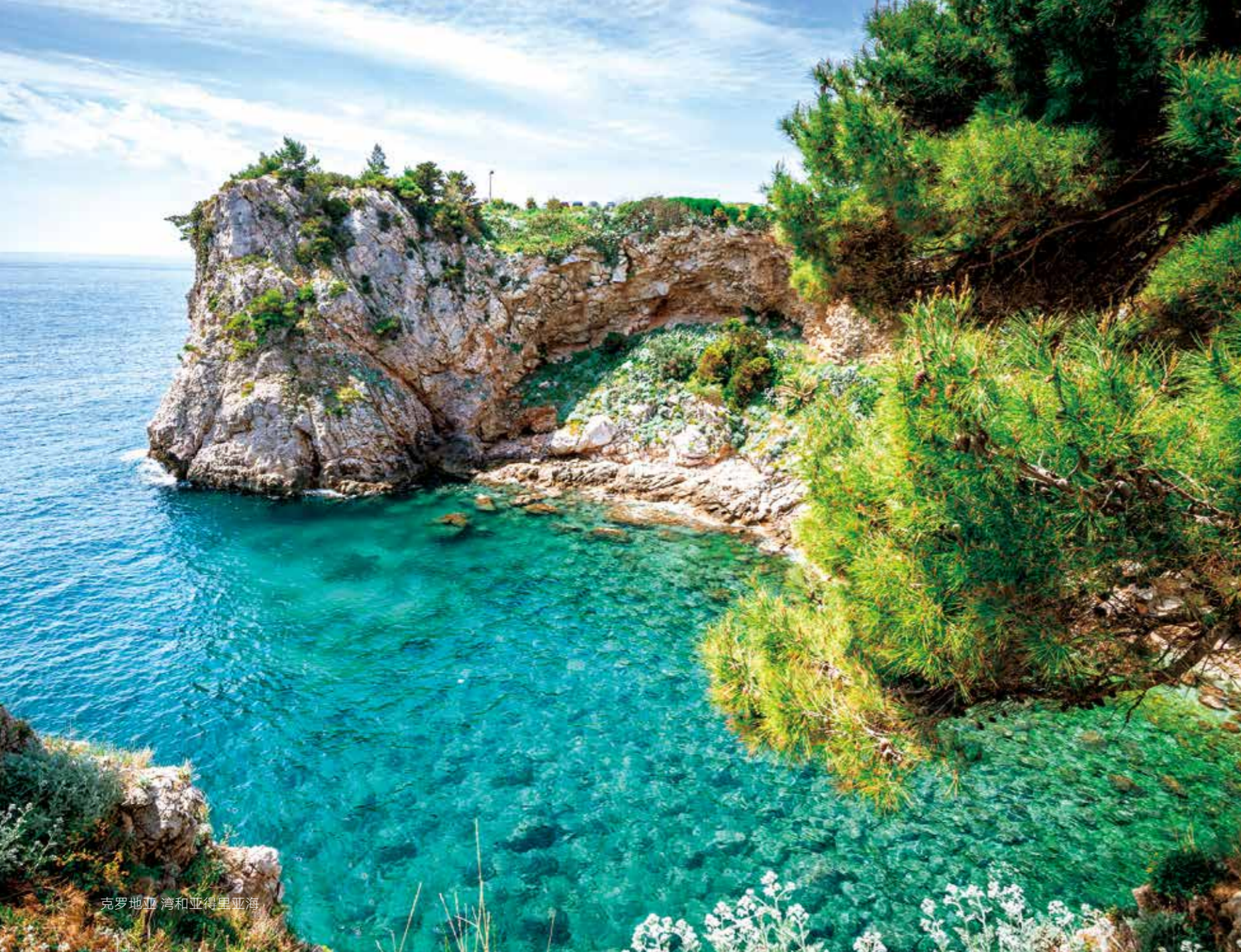
克罗地亚 湾和亚得里亚海