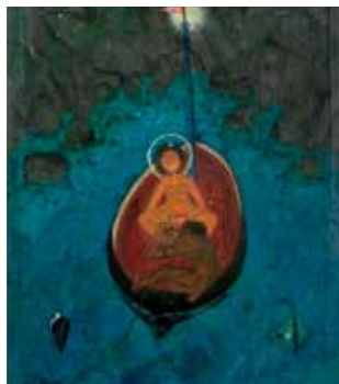
蓝色洞穴 / 在船上