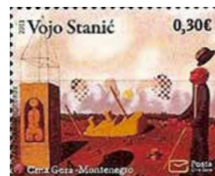
黑山为画家 沃约·斯坦尼奇发行的邮票