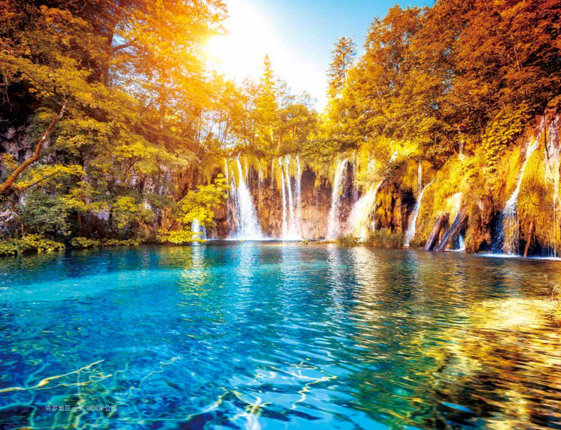
克罗地亚 十六湖国家公园