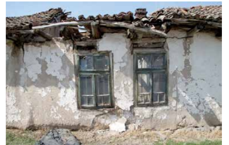
该居民房屋已经很久没人住了。

保加利亚媒体网站 Sofiaglobe.com 最近一段时间点击率最高的新闻是关于保加利亚农村地区的一篇报道，它指出了保加利亚农村的典型景象：老旧，人少，贫穷。图中是一家学校，现在已经没有学生在这里上学了。