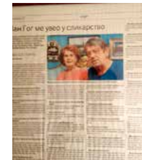
当地报纸对画家及其妻子的报道