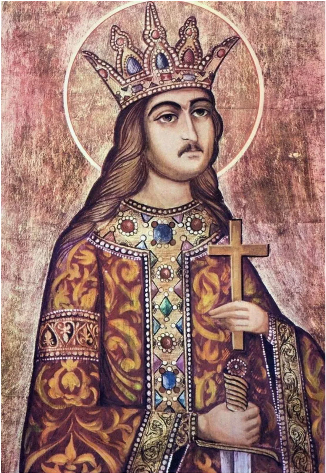
斯特凡大公被认为是基督教圣人 [1]

这一时期，摩尔达维亚地区的修道院和教堂建设达到了巅峰，许多著名的修道院和教堂均在此时修建，如苏切维察（Sucevița）修道院和苏恰瓦（Suceava）圣约翰教堂。如今，这些古老的修道院因为其独特的拜占庭艺术绘画而被列入联合国教科文组织世界文化遗产 [2] 名录，吸引着无数游客前来探索。该区域的中心城市为雅西（Iași），该城是摩尔达维亚地区的文化和经济中心。