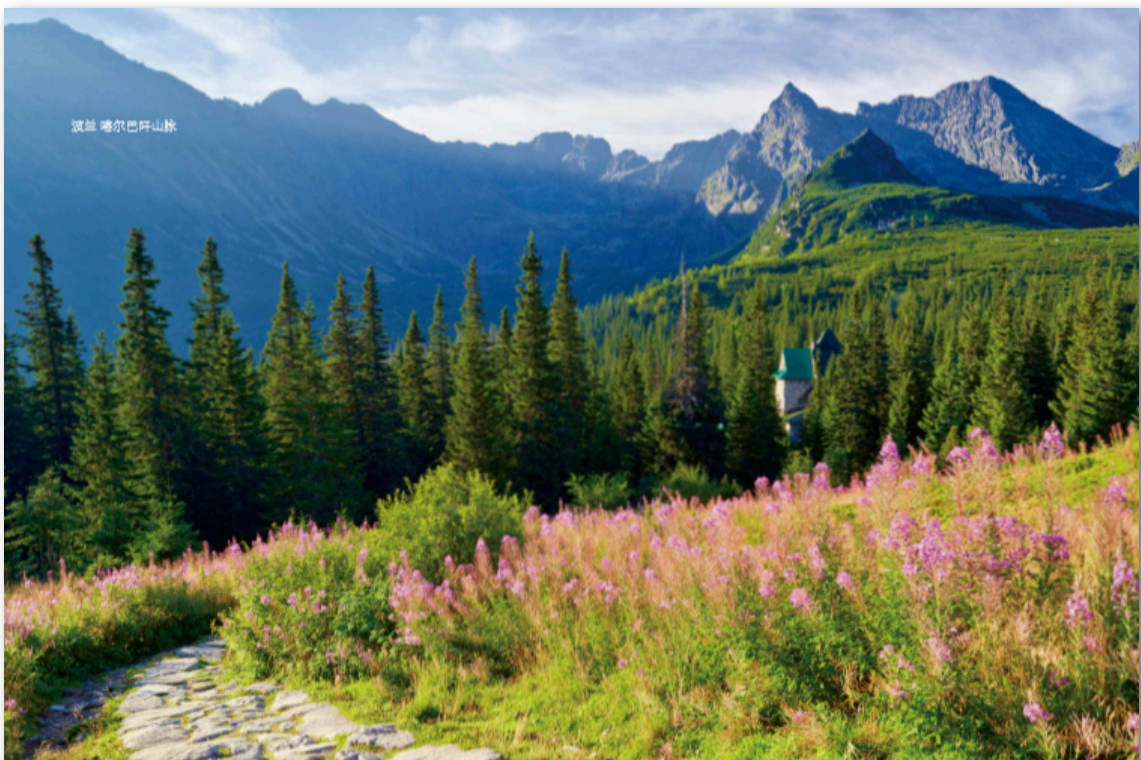
波兰 喀尔巴阡山脉

https://www.intellinews.com/hungary-signs-agreement-with-uae-on-construction-of-5bn-city-centre-mini-dubai-in-budapest-316883/?source=united-arab-emirates