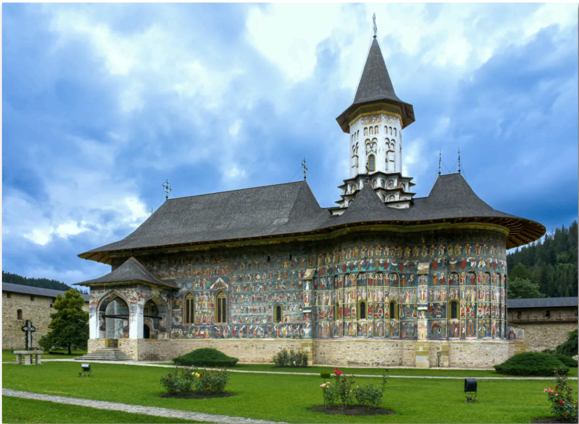
- 罗马尼亚 苏切维察修道院 -

本刊物旨在为读者提供关于中东欧国家及相关国家最新的多样化资讯，所摘译文章不代表本刊物观点。部分文章标题有改动。