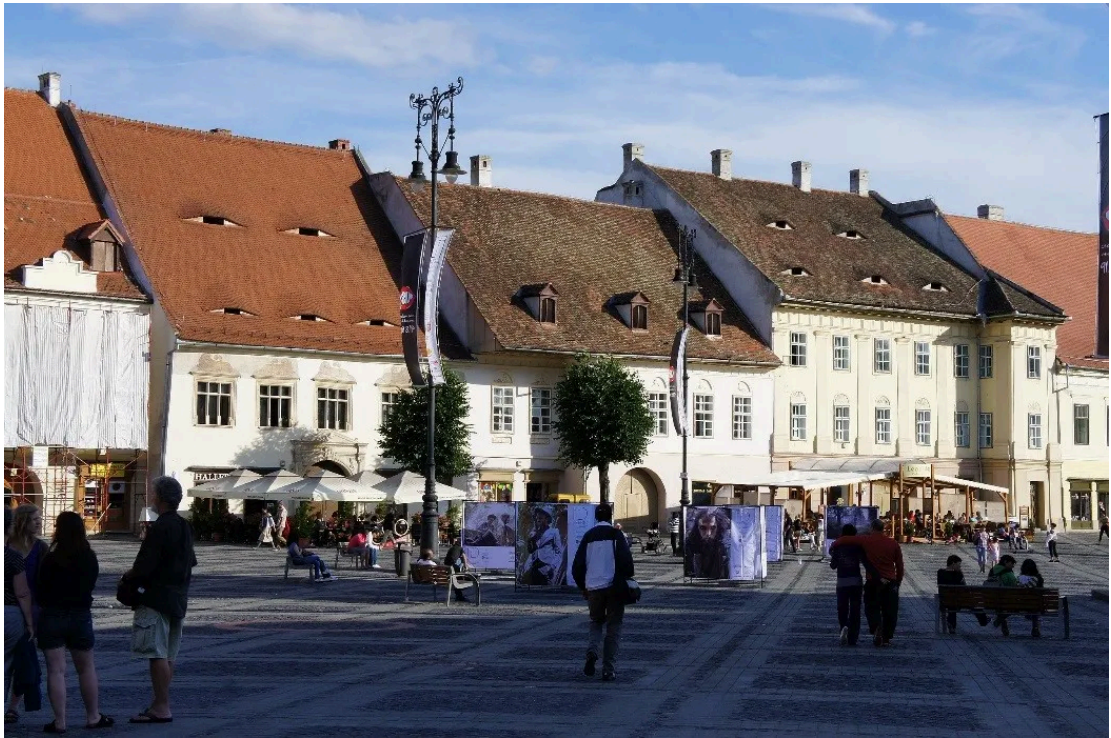
锡比乌老城“长眼睛”的屋顶 [9]

摩尔达维亚、瓦拉几亚和特兰西瓦尼亚三个区域彰显出罗马尼亚历史和文化的多样性，各区域多元的历史文化遗产不仅丰富了该国的文化景观，也为罗马尼亚人的文化和身份认同提供了难得的资源。