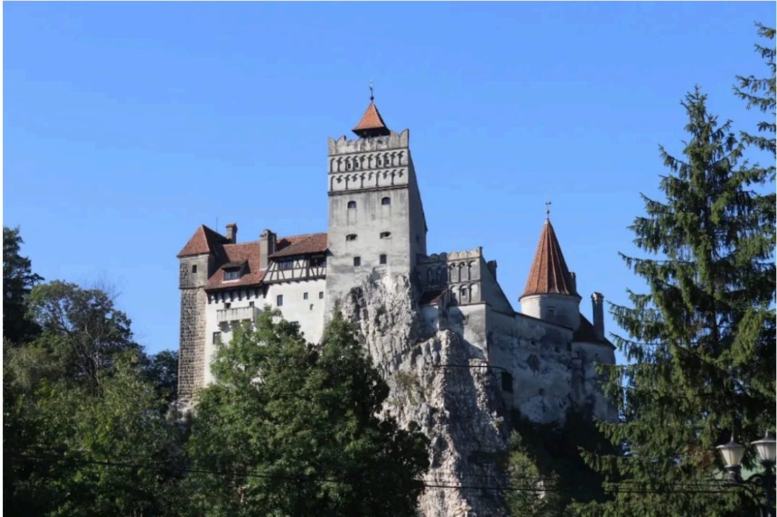
所谓的“吸血鬼城堡” [5]

瓦拉几亚位于罗马尼亚的南部，也是一个古老的封建公国。其历史可以追溯到14世纪末，该公国的创建者是米尔恰大公，他将瓦拉几亚打造成了一个强大的政治实体，并与奥斯曼帝国进行了多次战争。15世纪，弗拉德（Vlad the Impaler）成为瓦拉几亚的统治者，他以穿刺、使人流血致死这种残酷的刑罚对待奥斯曼土耳其俘虏甚至本国反对派。据说，就是这种残酷的刑罚激发了爱尔兰小说家布拉姆·斯托克的想象，创作出小说《吸血鬼德古拉》，以至于罗马尼亚有一座布兰城堡被贴上了“吸血鬼城堡”的噱头，招揽着全球游客。必须指出的是，这座城堡实际上并不位于瓦拉几亚，而是位于后文介绍的特兰西瓦尼亚地区。