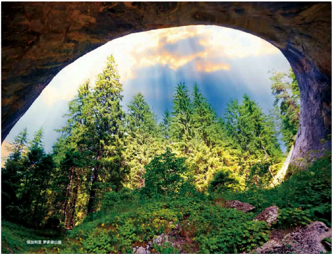
保加利亚 罗多彼山脉