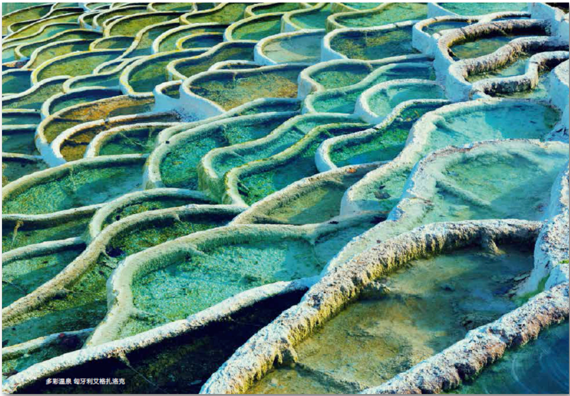
多彩温泉 匈牙利艾格扎洛克