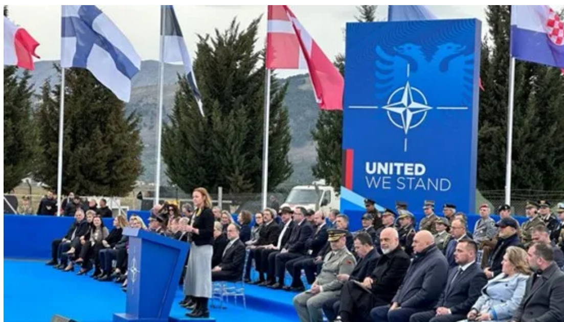
阿尔巴尼亚总统、总理、国防部长等在主席台就坐