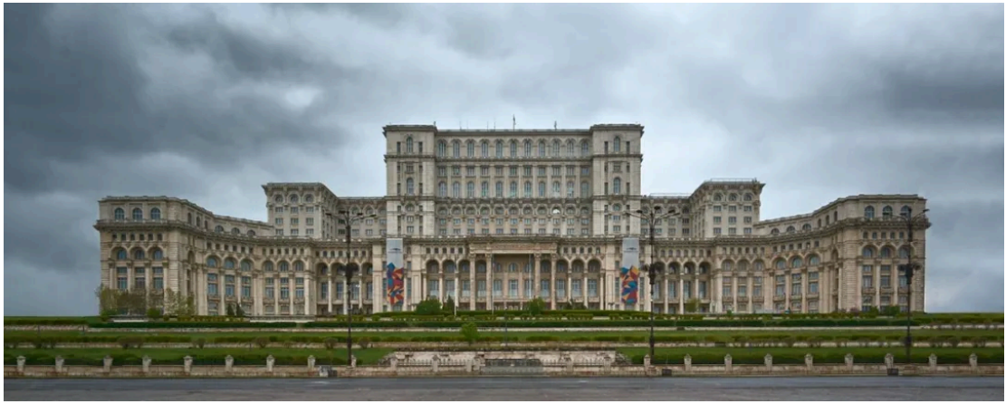
全世界最大的议会大厦：罗马尼亚议会宫 [7]