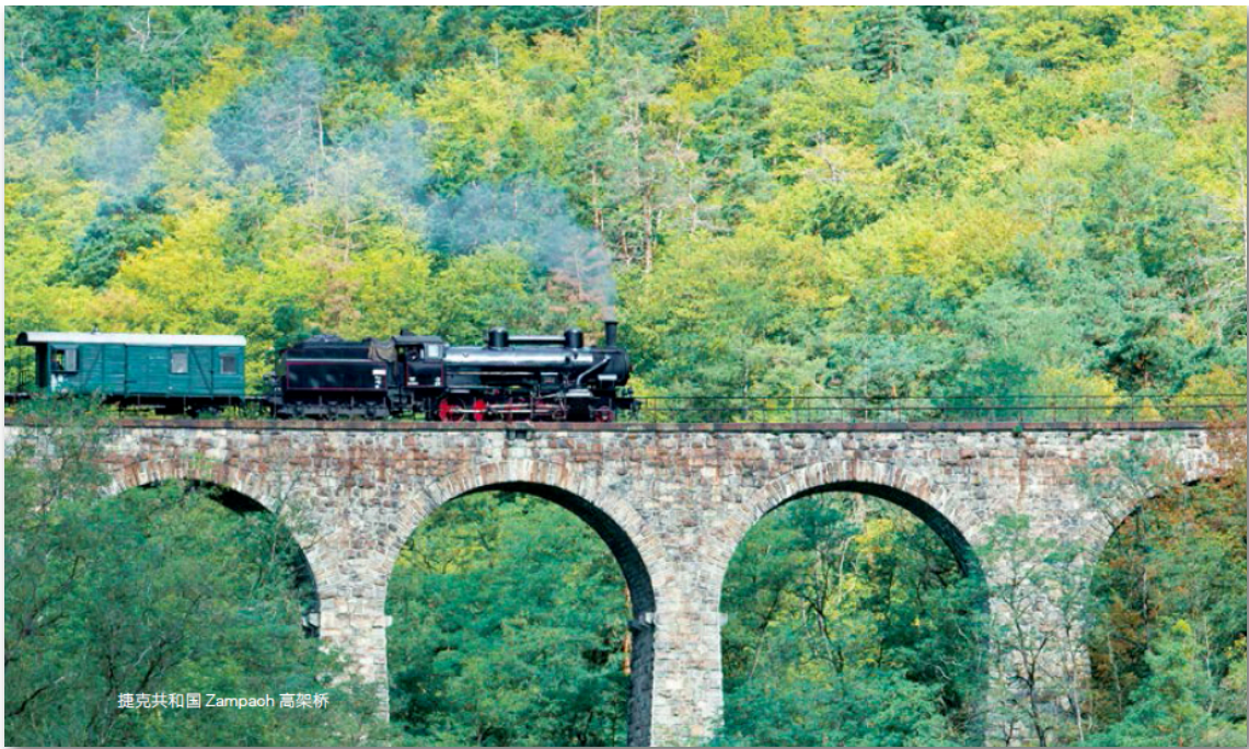
捷克共和国 Zampach 高架桥