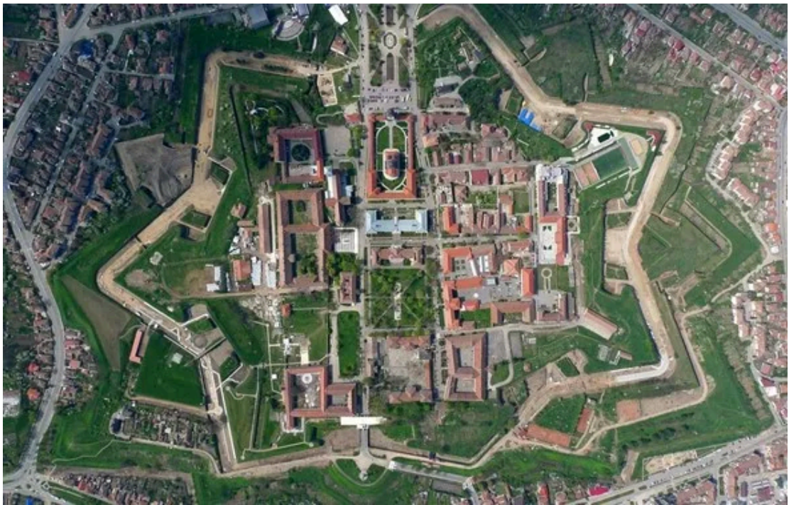
阿尔巴卡罗琳娜七星形城堡

19世纪初，特兰西瓦尼亚成为奥匈帝国的一部分，经历了经济和文化的繁荣，成为当时东欧地区的一个重要中心。第一次世界大战结束后，特兰西瓦尼亚被划归罗马尼亚，直到那时，现代罗马尼亚的版图才终于成型。如今，特兰西瓦尼亚地区以其多样化的文化遗产、古老的城堡和秀丽的自然景观而闻名于世，吸引着无数游客前来探索其丰富多彩的历史和文化。这里的重要城市为克卢日-纳波卡、布拉索夫和锡比乌，知名景点有：阿尔巴卡罗琳娜七星形城堡、科尔温城堡、锡比乌老城，等等。