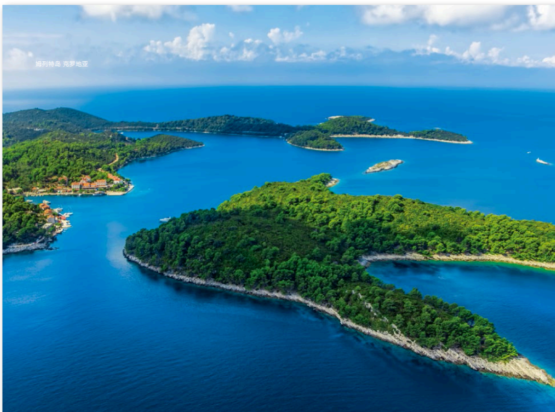
- 克罗地亚 姆列特岛 -

https://www.naftemporiki.gr/english/1620595/when-the-going-gets-tough-the-chinese-captain-gets-going/