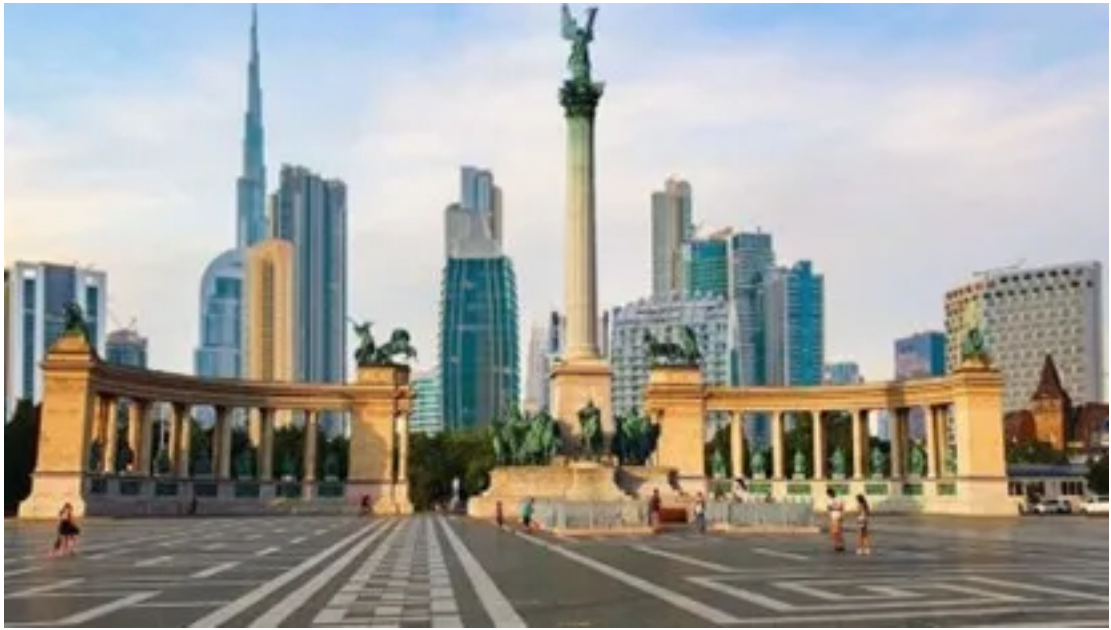
媒体想象的“小迪拜”效果图

尽管阿联酋的投资项目遭受争议，但西雅尔多在新闻发布会上仍强调，匈阿双方此举将为两国之间其他领域的合作铺平了道路。