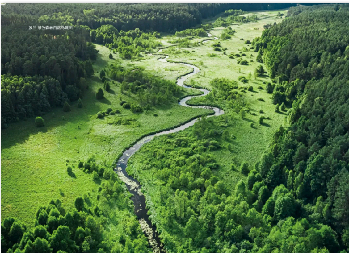
波兰 绿色森林自然鸟瞰图

https://visegradinsight.eu/how-to-foster-the-green-transition-while-decreasing-dependency-on-china/