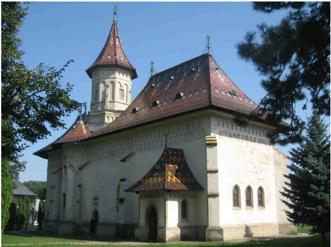
苏恰瓦 (Suceava) 圣约翰教堂 [4]

罗马尼亚的摩尔达维亚地区和其邻国摩尔多瓦西部的大部分地区，历史上均属于摩尔达维亚公国，且其名称几乎相同。