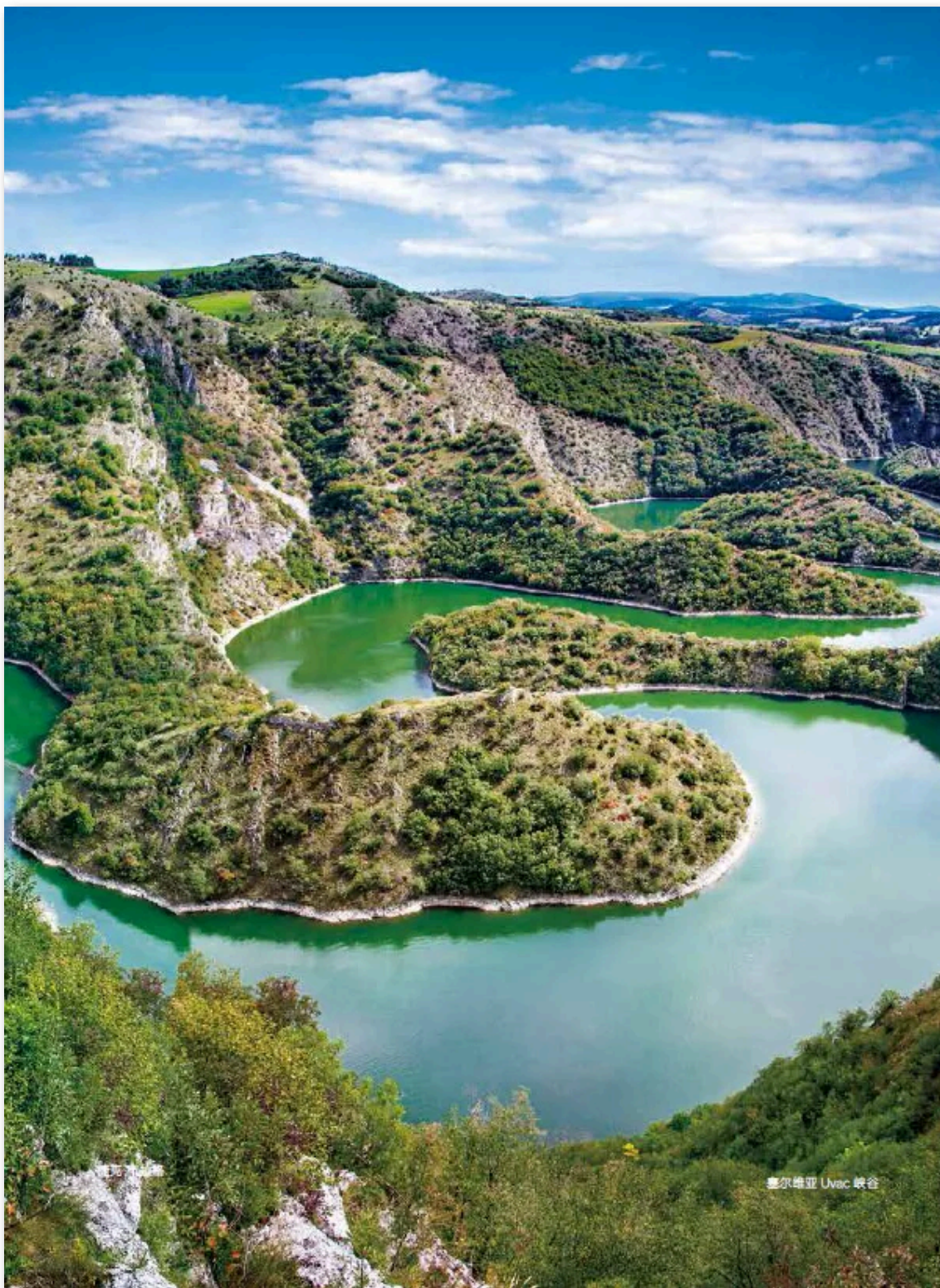
塞尔维亚 Uvac 峡谷

https://www.ekapija.com/en/news/4825155/linglong-to-invest-usd-645-million-in-stepping-up-production-in-zrenjanin