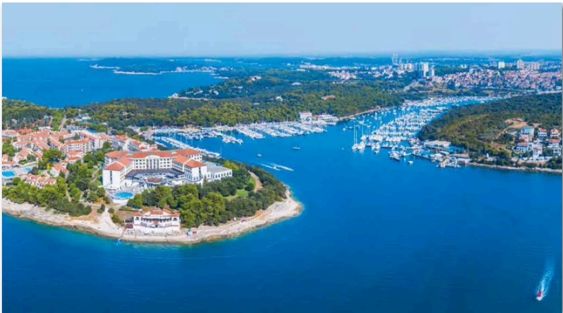
- 克罗地亚 普拉港市 -