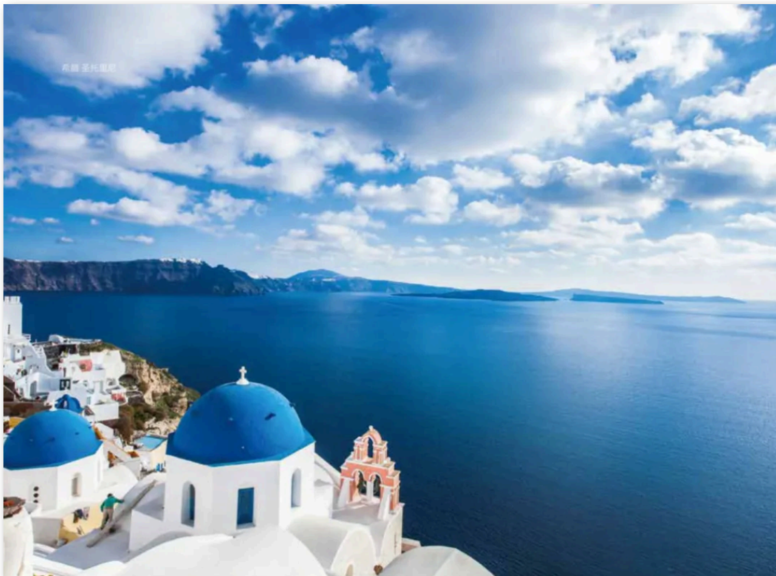
- 希腊 圣托里尼岛 -

https://energyworld.ro/2024/08/06/romania-ppc-takes-over-the-renewables-portfolio-of-evryo-formerly-cez-romania-for-700-million-euros-and-becomes-the-first-player-in-renewables-in-romania/