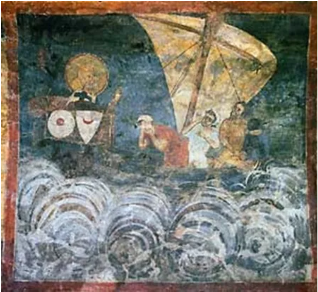
圣尼古拉斯拯救水手 [4]