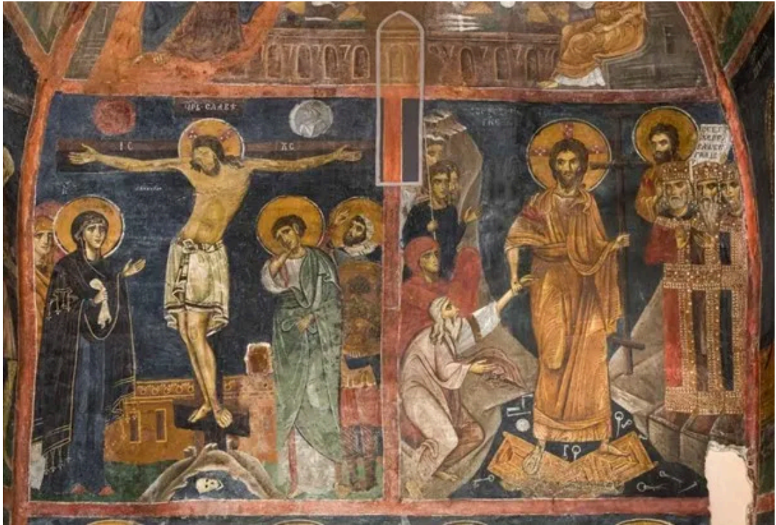
关于耶稣生平的壁画 (1) [7]