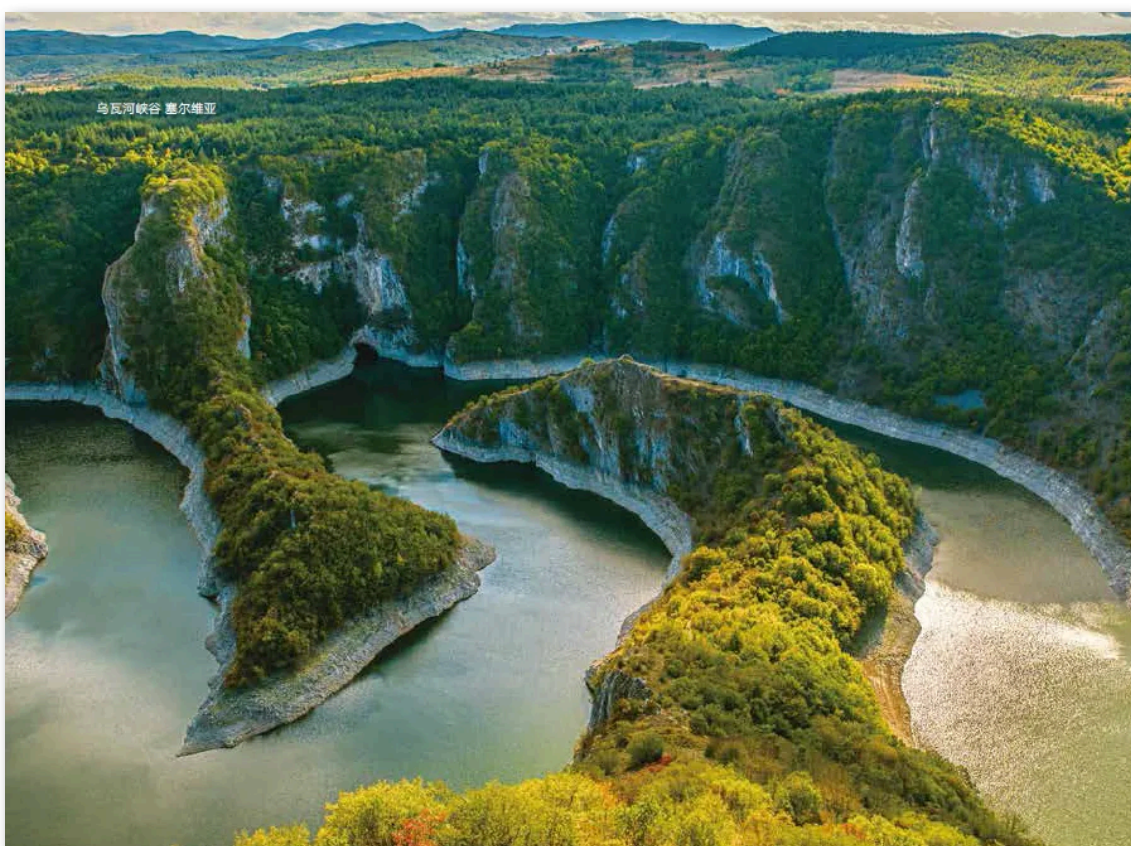
- 塞尔维亚 乌瓦茨峡谷 -

https://www.intellinews.com/serbia-close-to-securing-investment-rating-337463/?source=serbia