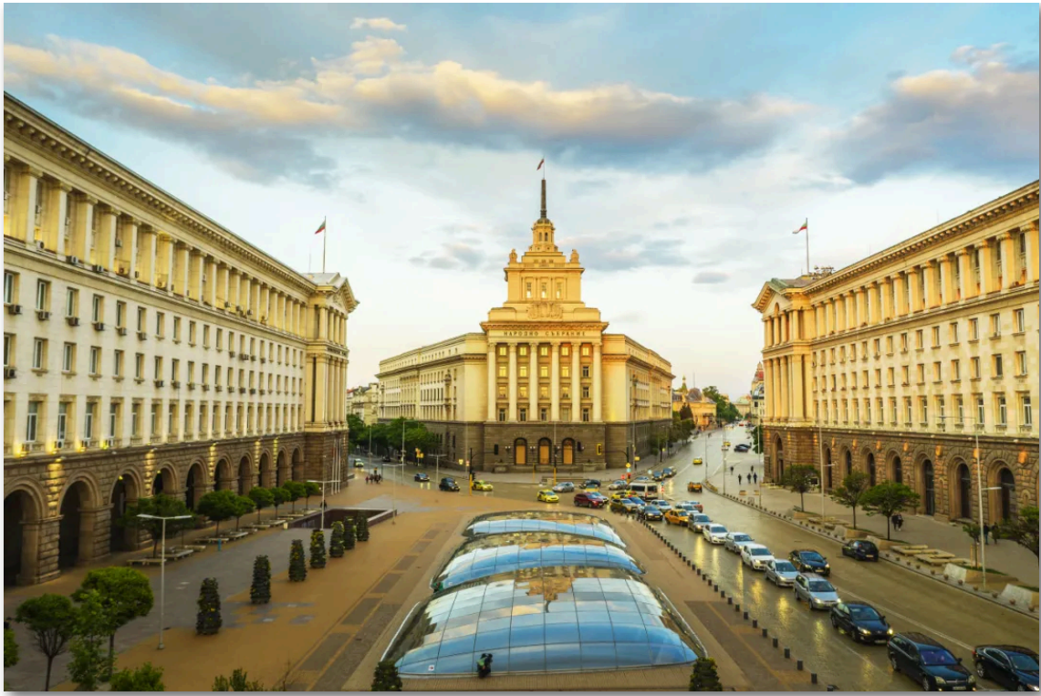
- 保加利亚 索非亚国民议会大楼 -

本刊物旨在为读者提供关于中东欧国家及相关国家最新的多样化资讯，所摘译文章不代表本刊物观点。部分文章标题有改动。