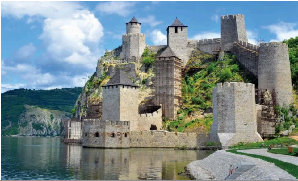
- 塞尔维亚 古卢巴克城堡 -