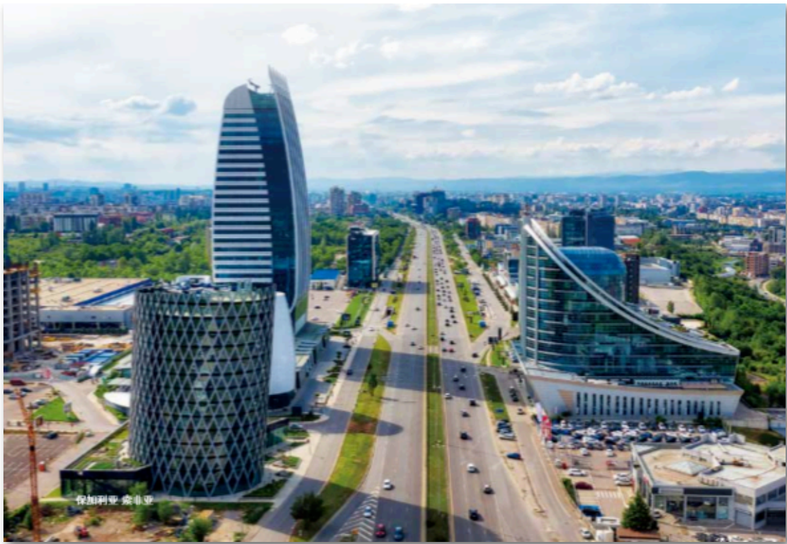
- 保加利亚 索非亚 -