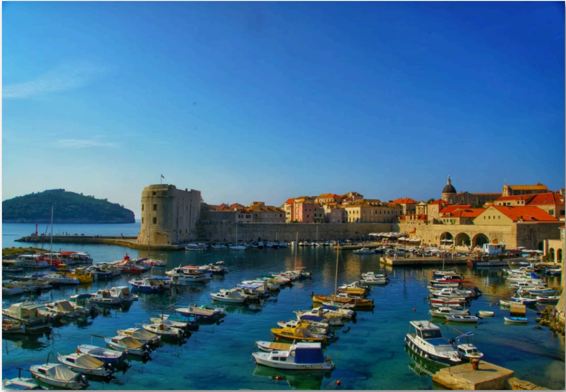
- 克罗地亚 杜布罗夫尼克 -

https://www.croatiaweek.com/world-record-giant-peka-cooked-in-croatia/