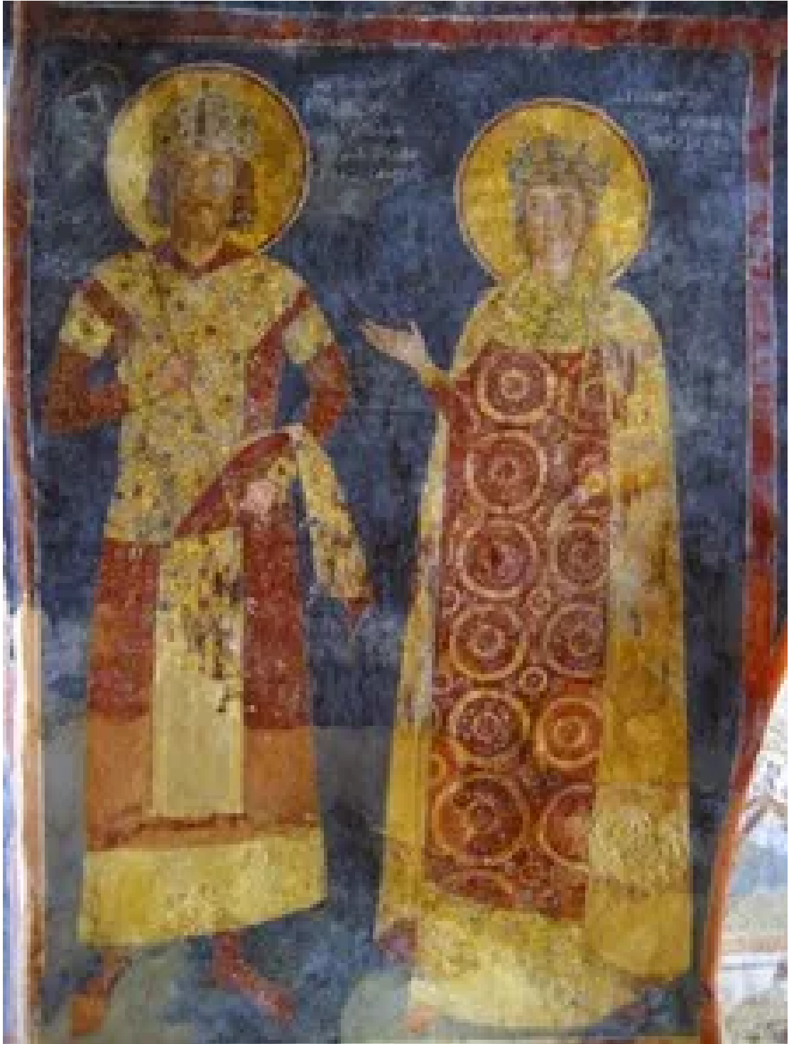
保加利亚沙皇康斯坦丁和妻子伊琳娜的肖像 [9]

这里还有保加利亚一位沙皇及其皇后的肖像，位于教堂的西墙上，是保加利亚沙皇康斯坦丁及其妻子伊琳娜的肖像。这幅壁画突出了他们作为东正教守护者和国家领袖的地位。这些肖像画不仅是宗教作品，也反映了当时保加利亚的政治和社会状况。通过将世俗领袖与宗教艺术结合，壁画强调了君权神授的理念。