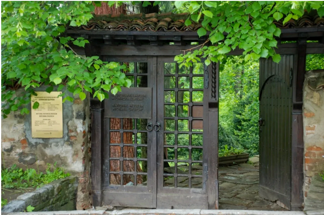
博雅纳教堂景区入口 [1]

在中东欧的众多世界文化遗产中，有一处面积十分狭小，甚至可以说仅为方寸之地，每一次只允许10人左右作为一组同时进入参观，需要跟随专门的讲解人员进行，在教堂内的停留时间只能在15分钟左右。然而，它以其源自13世纪的精美壁画和深厚的宗教意义，成为中东欧地区最小、但极具价值的文化瑰宝之一。它就是位于保加利亚首都索菲亚郊区的博雅纳教堂。