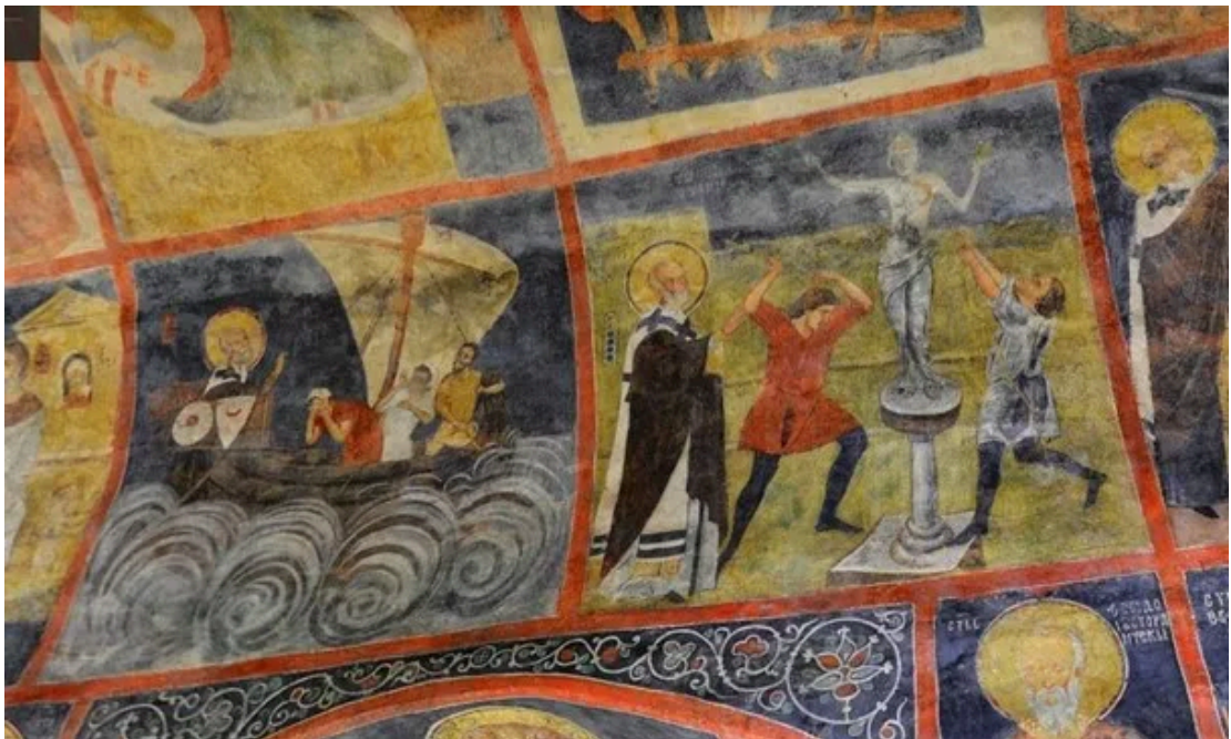
圣尼古拉斯祝福破坏异教徒雕像（维纳斯）的民众（右侧图画） [5]

再比如关于耶稣生平场景的壁画，位于教堂的南墙和穹顶。这一系列壁画描绘了耶稣生平的关键时刻，包括其诞生、洗礼、受难和复活等画面。这些场景是基督教艺术的经典题材，展示了耶稣的神圣使命和拯救人类的意义。壁画中的人物形象表现出浓厚的情感，艺术家以现实主义手法刻画了耶稣及其门徒的面部表情和动作。