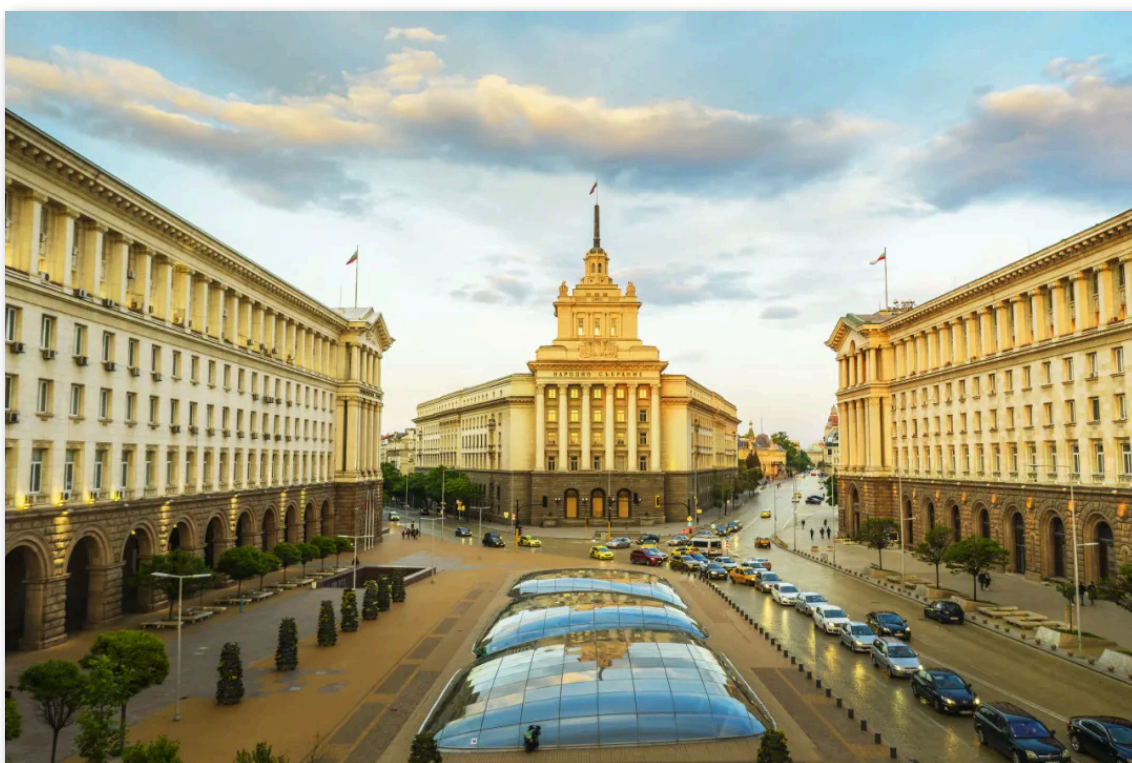
- 保加利亚 国民议会大楼 -

https://www.euractiv.com/section/politics/news/bulgarias-parliament-approves-new-government-after-months-of-coalition-talks/ , https://www.dw.com/de/nach-sieben-wahlen-bulgarien-hat-eine-neue-regierung/a-71326163