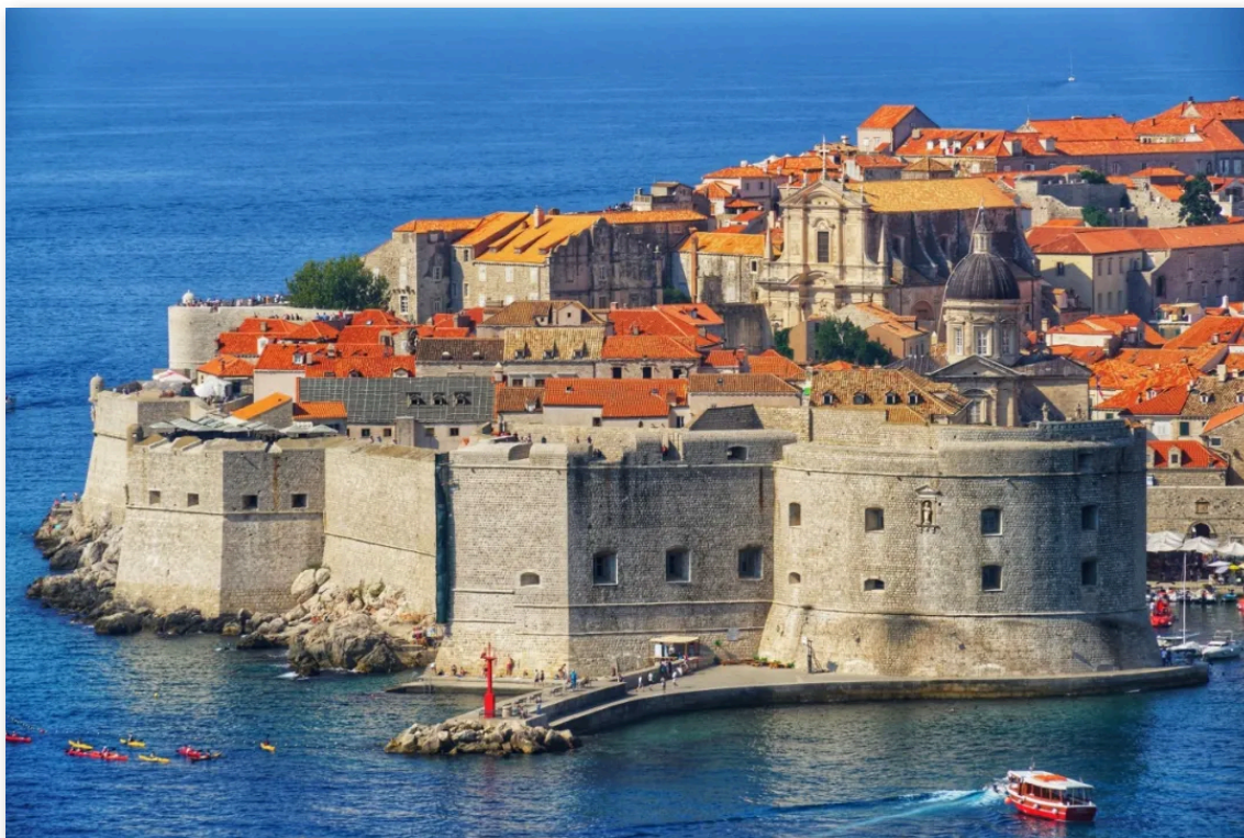
- 克罗地亚 杜布罗夫尼克 -

https://sarajevotimes.com/fierce-reactions-following-the-decision-on-minimum-wage-in-the-fbih-who-wins-and-who-loses/