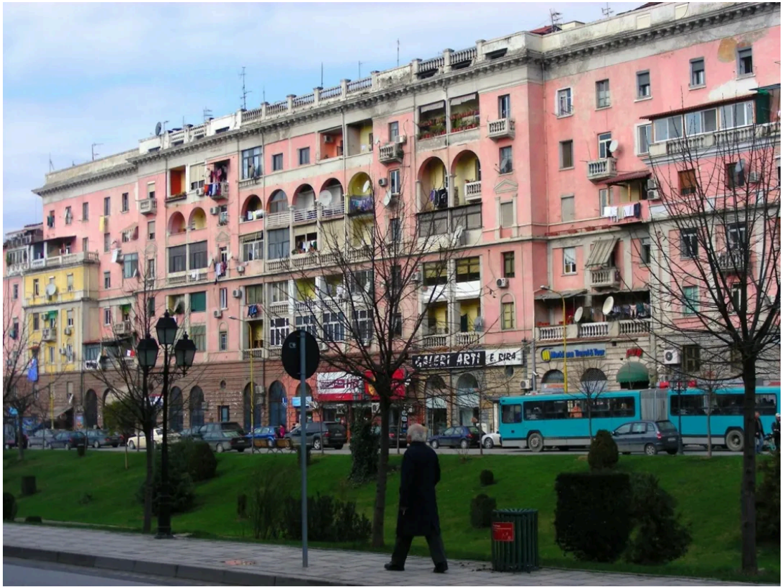
现如今“封锁区”的建筑 [3]

直到上世纪90年代，阿尔巴尼亚发生了剧变，社会开始向更加开放的氛围迈进。“封锁区”开放后，普通市民可自由出入。这里逐渐成为地拉那最时尚的区域，其拥有众多高档餐厅、酒吧和精品店；而1991年建成的台湾中心（也有一说建成于2000年之后）位于拉那河北岸，与原来的封锁区虽仅一步之遥，却在周围公园的烘托下，保留了更为大众化、市民化的氛围。无论是剧变之前还是剧变之后，台湾中心所在的区域与拉那河对岸的“封锁区”始终显得格格不入。其既处于相同的区域内，又处于不同的氛围中，这样的差异有些许类似中国大陆与台湾省之间被一海峡分割开来的局面。这可能就是“台湾中心”得名的由来吧。至于是否真实，现在从公开的资料中难以得到确认，也许需要查询地拉那市政府关于这片区域、这座综合体命名的有关文件之后，说不定就能得到验证。