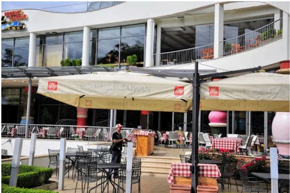
台湾中心外的咖啡座 [7]

台湾中心所在的青年公园内种植了多种树木和花卉，春夏时节绿意盎然，吸引了大量游客和摄影爱好者。设在台湾中心前面的现代化喷泉和蜿蜒的小径为游客提供了放松和漫步的好去处。园内的露天区域经常举办小规模节庆活动、展览等，成为城市文化生活的重要部分，也吸引了众多游客来此参访。