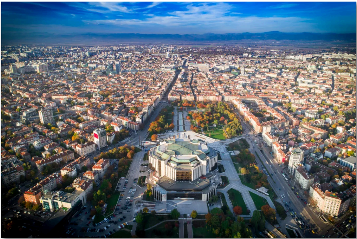
- 保加利亚 索非亚国家文化宫 -