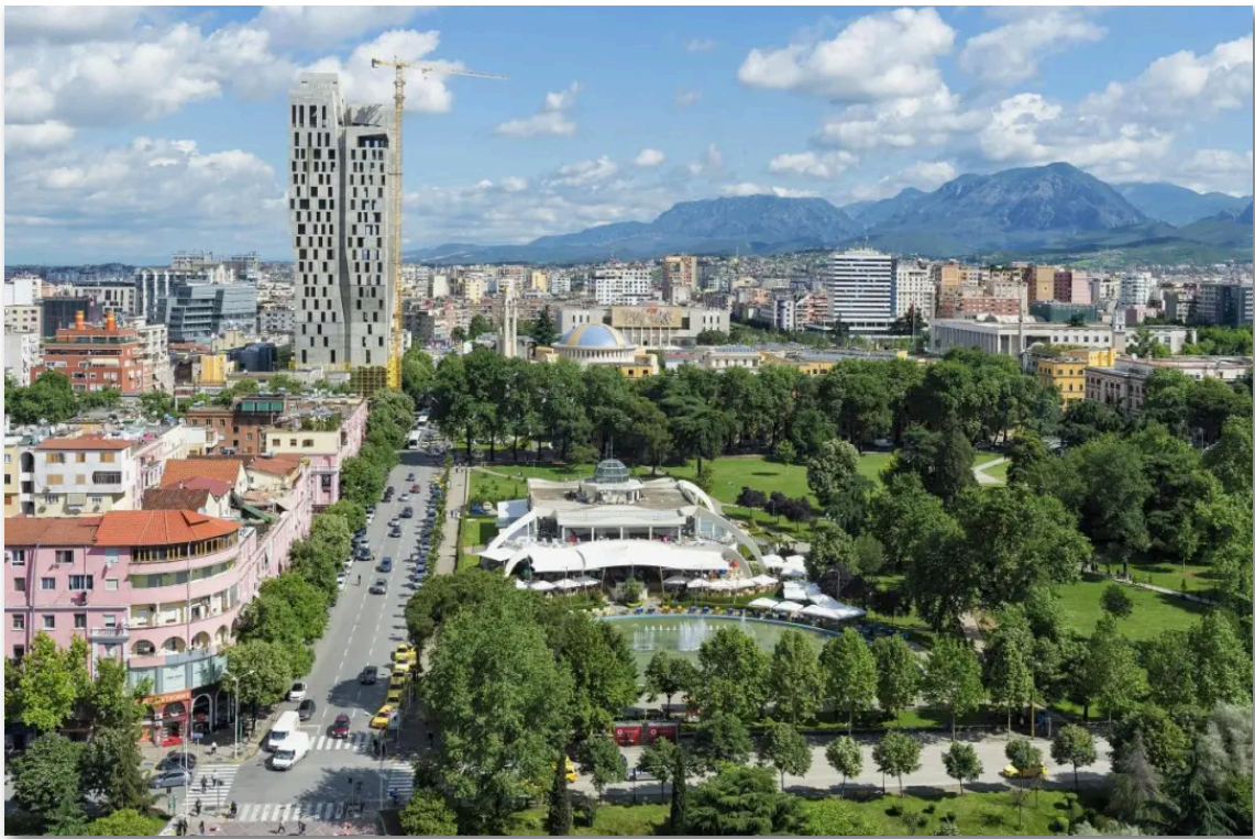
- 阿尔巴尼亚 地拉那民族烈士大街 -

本刊物旨在为读者提供关于中东欧国家及相关国家最新的多样化资讯，所摘译文章不代表本刊物观点。部分文章标题有改动。文中所使用风景照片主要来自“视觉中国”，并已获得合法授权。