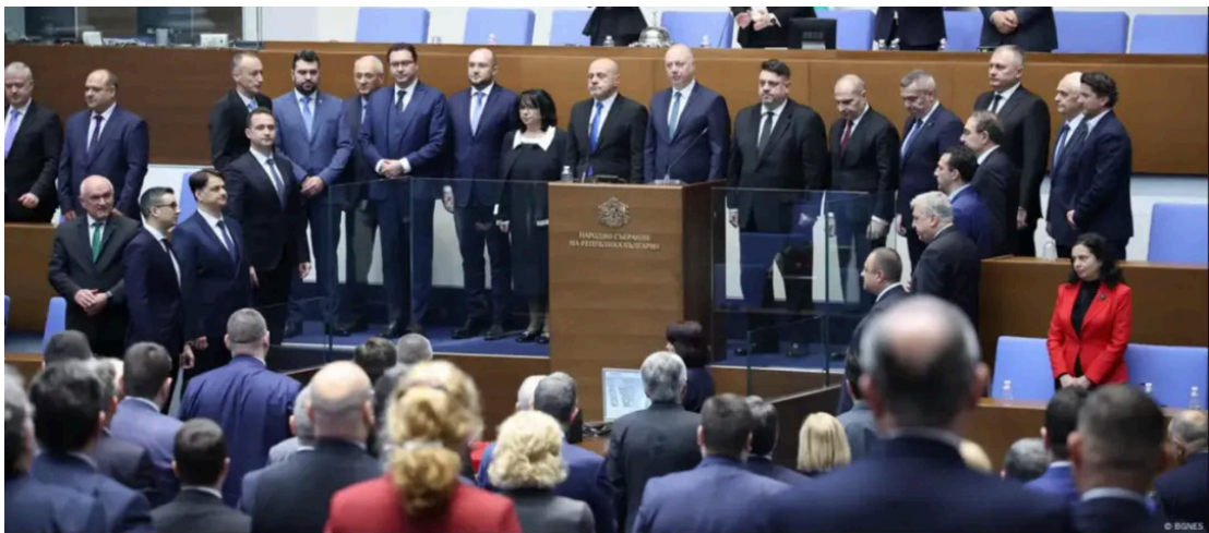
保加利亚新政府成立

保加利亚议会批准了由前议长罗森·泽列兹科夫（Rosen Zhelyazkov）领导的新政府，结束了历时数月的组阁谈判。保守派的欧洲发展公民党（GERB）在2024年10月举行的提前大选中赢得第一，但需与其他政党进行艰难谈判方能组建政府。在保议会240个议席中，125名议员支持泽列兹科夫的内阁提名，为新政府的最终成立铺平了道路。