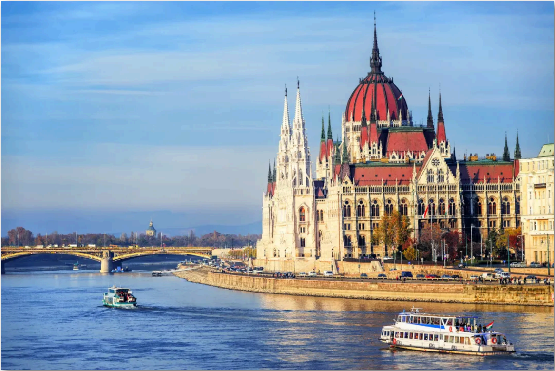
- 匈牙利 布达佩斯 -

https://www.budapesttimes.hu/corporate/hungary-airlines-starts-test-flights/