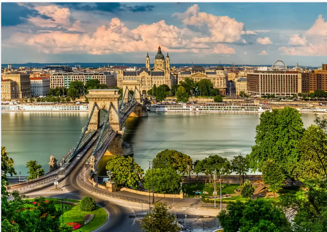
- 匈牙利 布达佩斯 -

https://europeanconservative.com/articles/news/hungary-hits-back-at-brussels-for-permanently-blocking-e1-billion-eu-funds/