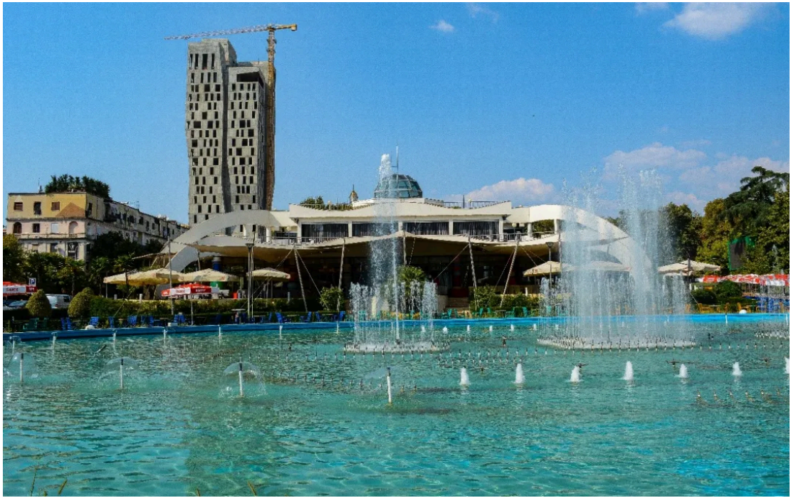
地拉那的台湾中心 [1]

台湾中心坐落于首都地拉那市中心的青年公园（Rinia Park），其历史可追溯到阿尔巴尼亚社会主义时期。关于“台湾中心”这一名称的来历，有这样一种说法：