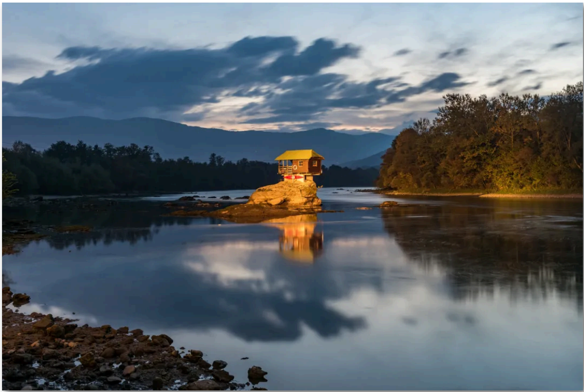
- 塞尔维亚 河中小屋 -