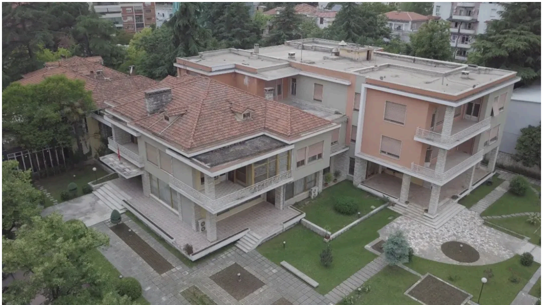
阿尔巴尼亚原领导人霍查的故居位于“封锁区”内 [2]

早在上世纪70年代，这一地区是一片开放的公共空间，在其南面是穿城而过的拉那河，而河对岸则是地拉那的“封锁区（Blloku）”，两边的场景形成了鲜明对比：青年公园是普通市民的休闲场所，而“封锁区”则是当时国家领导人的专属生活区，两边泾渭分明。