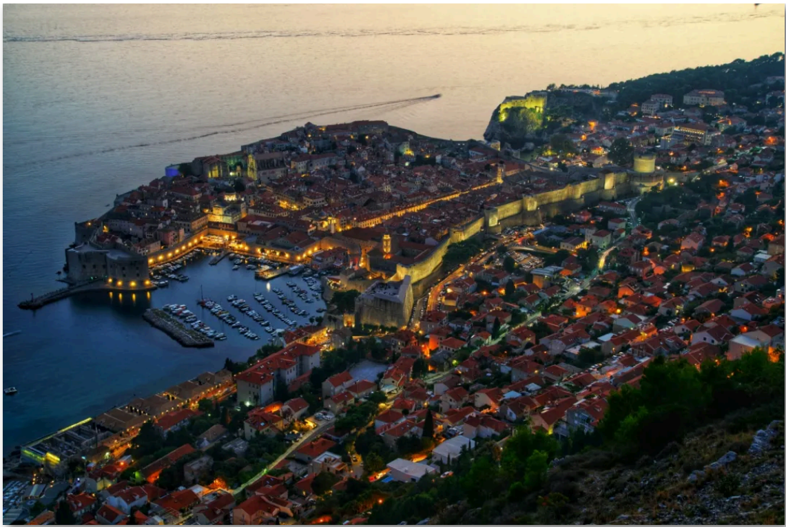
- 克罗地亚 杜布罗夫尼克 -