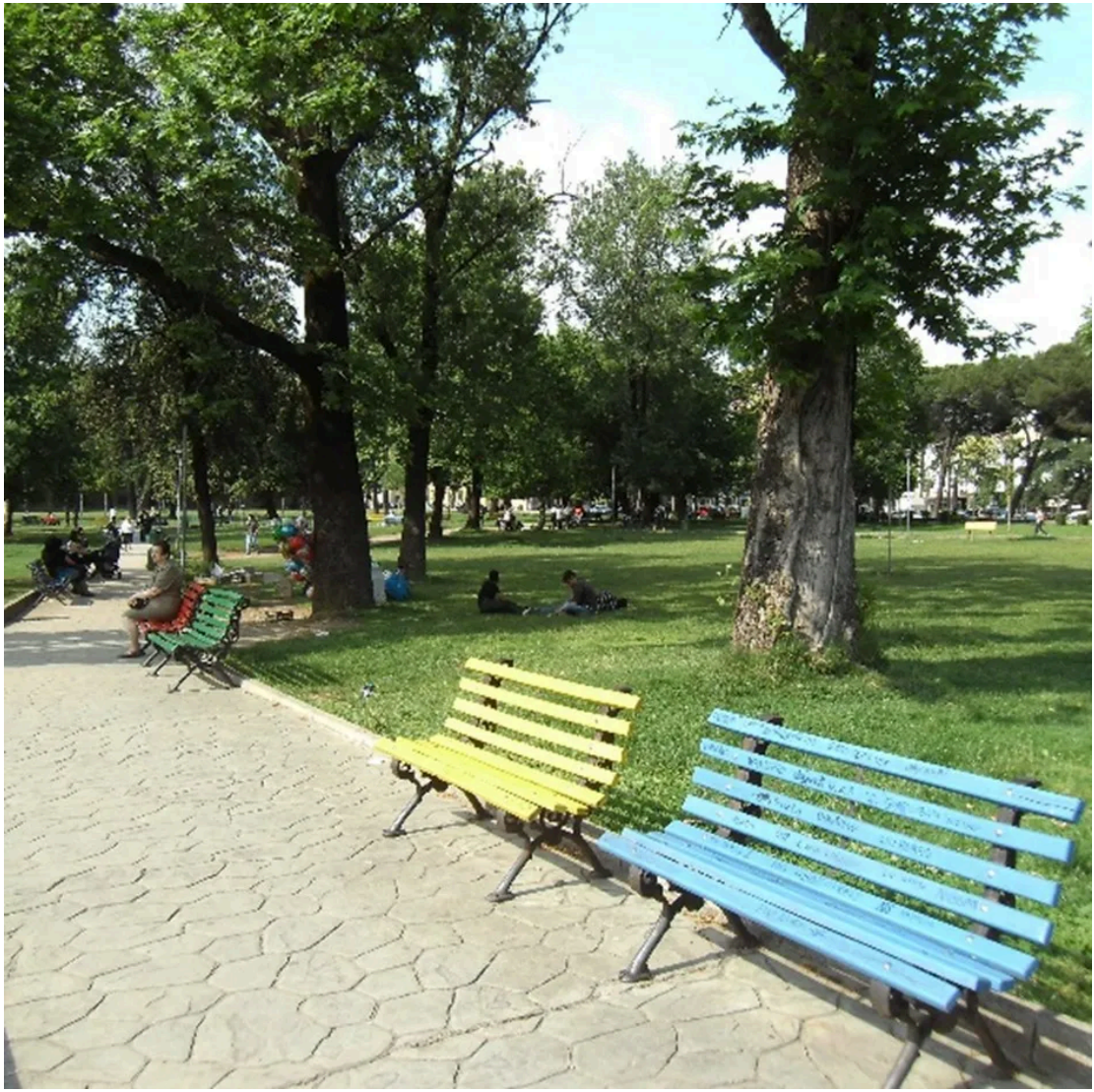
青年公园内景 (1) [8]