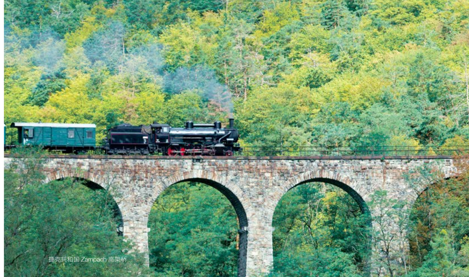
捷克共和国 Zampach 高架桥

格但斯克深水集装箱港口是发展最快的集装箱港口，在全世界同类港口中排名前 15 位。