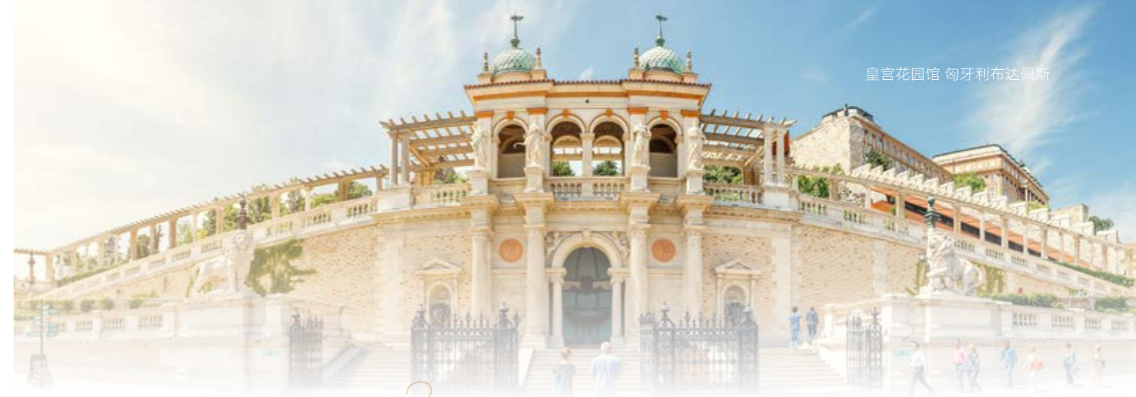
皇宫花园馆 匈牙利布达佩斯