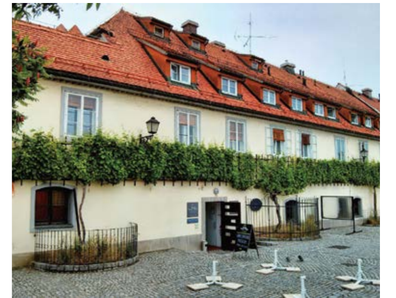
图 2：欧洲最古老的葡萄藤生长于斯洛文尼亚的马里博尔 16

当然是有的，这株葡萄藤如今就在斯洛文尼亚马里博尔 (Maribor) 市的兰特区 (Lent Quarter)。它拥有专属名称，称做斯塔拉·特尔特 (Stara trta，有的地方拼写为 Stare trte)，也叫“老藤 (Old Vine)”；它拥有专属的博物馆，名叫葡萄酒博物馆 (Vinotheque Museum)；还拥有专属的赞歌，叫做“老藤之歌 (Anthem to Old Vine)”；它还有专属的网站 15 。可以确信，这是全世界最有特色的葡萄藤。