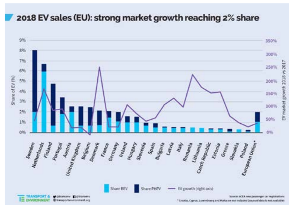
图 1: 欧盟各国 2018 年电动车在整车销量中的占比

从具体国家来看, 欧盟东西部国家之间的电动车销量存在明显差异。欧盟 11 个最大的电动汽车市场均来自欧盟西部成员国。瑞典位居榜首, 2018 年其电动汽车销量占汽车总销量的 8%, 荷兰、芬兰、葡萄牙、奥地利和英国紧随其后。