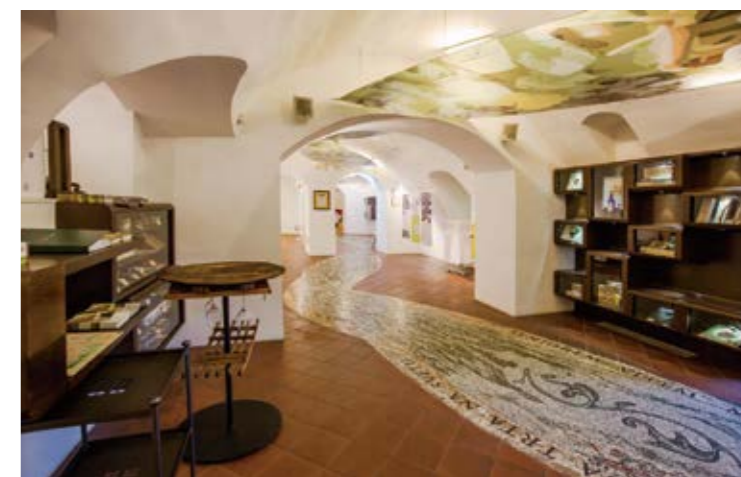
图 4: 老藤博物馆里的马赛克雕塑 19

今天，老藤有了自己专属的葡萄酒商照顾它。当它在2004年获得吉尼斯世界纪录、成为世界上最古老的葡萄藤时，它就成了斯洛文尼亚的一个地标。它所附着的房屋现在是一座博物馆，致力于向游客介绍该地区的葡萄酒文化。2015年，博物馆的地板上还镶嵌了一大片马赛克雕刻，它歌颂老藤，并讲述马里博尔过去的故事。