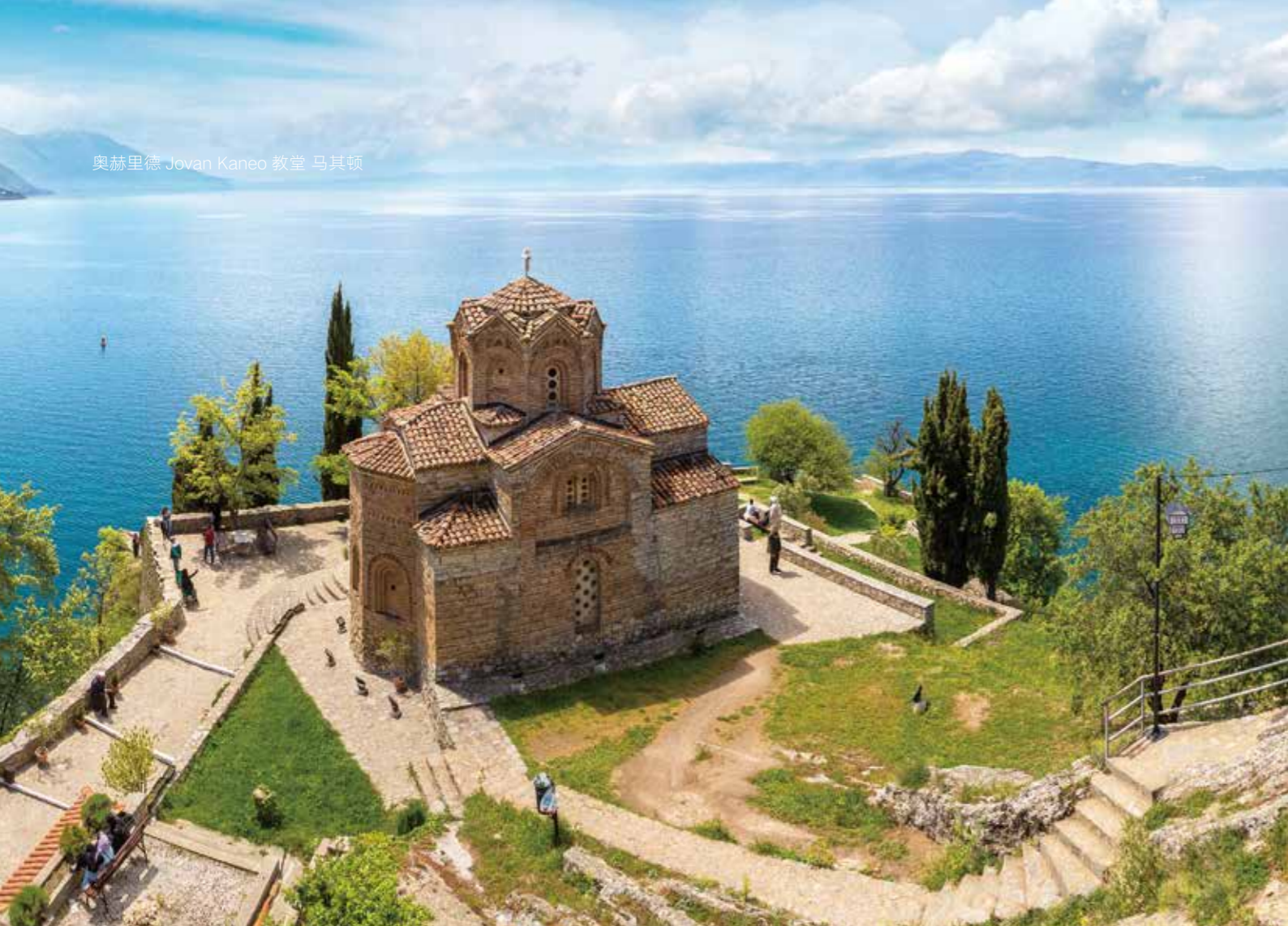
奥赫里德 Jovan Kaneo 教堂 马其顿