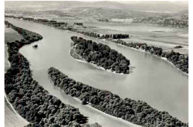
(图片说明：索罗斯一家在距离布达佩斯约 17 公里的北部多瑙河上的一个小岛 (Lupa Island) 上曾经拥有度假别墅 19 )

从他们的姓来看，他们肯定不是马扎尔人；实际上，他们是德意志化的犹太人。然而，在当时纳粹德国反犹太主义的宣传攻势下，施瓦茨一家人、特别是母亲伊丽莎白对于自己的犹太人身份非常忌讳，他们也从不参加犹太人的宗教活动。因此，乔治·施瓦茨 (也就是后来的索罗斯) 成长在一个有名无实的犹太人家庭。当反犹太浪潮在匈牙利高涨的时候，1936 年，也就是索罗斯六岁时，父亲提瓦达·施瓦茨买通了匈牙利的政府官员，将全家人的姓改为“Soros”，名字则改为基督教的写法，摆脱了自己唯一的犹太人印记。“Soros”在匈牙利语中的意思是“指定的继承人”，在世界语中的意思是“将要腾飞” 20 。于是，乔治·施瓦茨 (György Schwartz) 的名字变为了 George Soros (乔治·索罗斯)。