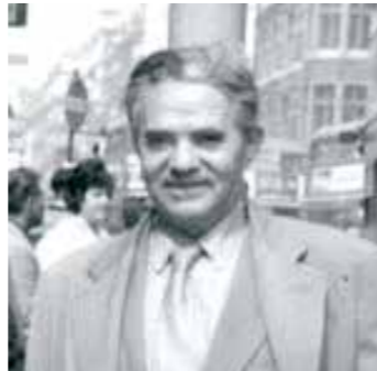
(图片说明：乔治·索罗斯的父亲提瓦达·施瓦茨 17 )

1930 年 8 月 12 日，索罗斯出生在匈牙利布达佩斯，真名为乔治·施瓦茨 (György Schwartz，其中 György 是他的名，Schwartz 是他的姓，按照匈牙利人姓在名前的习惯，他的真名应该写为 Schwartz György。下文为了读者