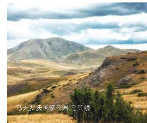
马夫罗沃国家公园 马其顿

马其顿改善经济前景做出贡献。基金的优势还体现在它能将中东欧地区与中国联系起来。因此，我希望基金可以成为交流信息的中介，激励中马双方更好地了解对方，找到并落实互惠互利的项目。