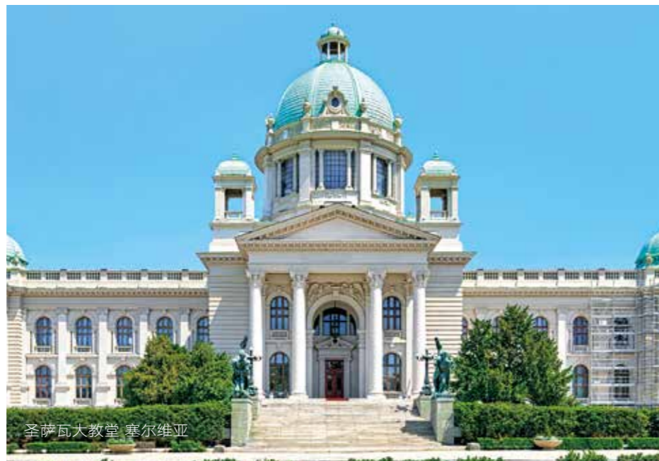
圣萨瓦大教堂 塞尔维亚

4月24日，罗马尼亚、保加利亚和希腊三国总理及塞尔维亚总统在布加勒斯特召开峰会，讨论在交通和电信行业加强合作。在会后举行的记者招待会上，塞尔维亚总统武契奇表示：“我们希望罗马尼亚、希腊和保加利亚给予塞尔维亚更大的支持，我们希望成为下一个加入欧盟的国家。”在此次峰会期间，四国着重讨论了在公路等基础设施建设方面的合作。