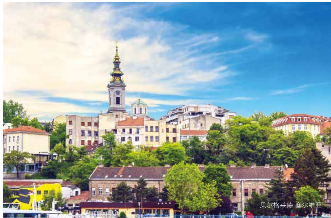
贝尔格莱德 塞尔维亚