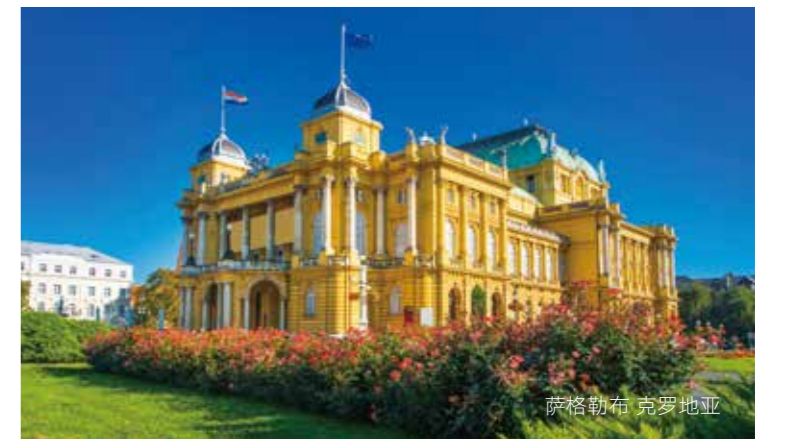
萨格勒布 克罗地亚