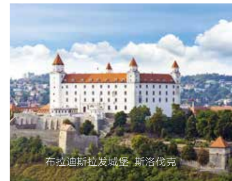
布拉迪斯拉发城堡 斯洛伐克