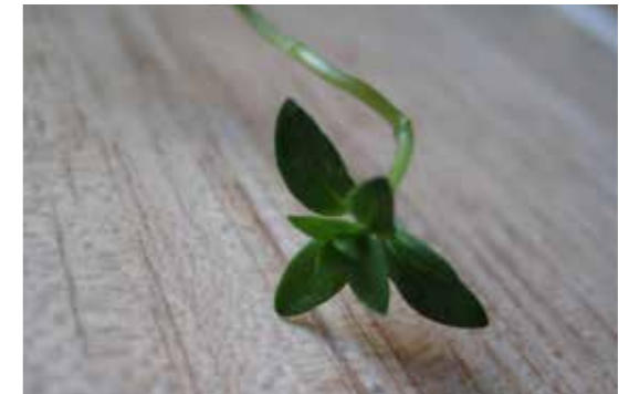
图 6：百里香 31

至于麝香草，它其实也有一个别名，叫百里香。关于它的来历，有一种很凄美的传说：特洛伊的海伦 (Helen of Troy) 因为看见特洛伊战争的残忍而忍不住落泪，她的泪珠溅到地上，就变成了百里香的小叶子 30 。现在，百里香也是西餐里很常用的一味调料了，新鲜的百里香是这样的：