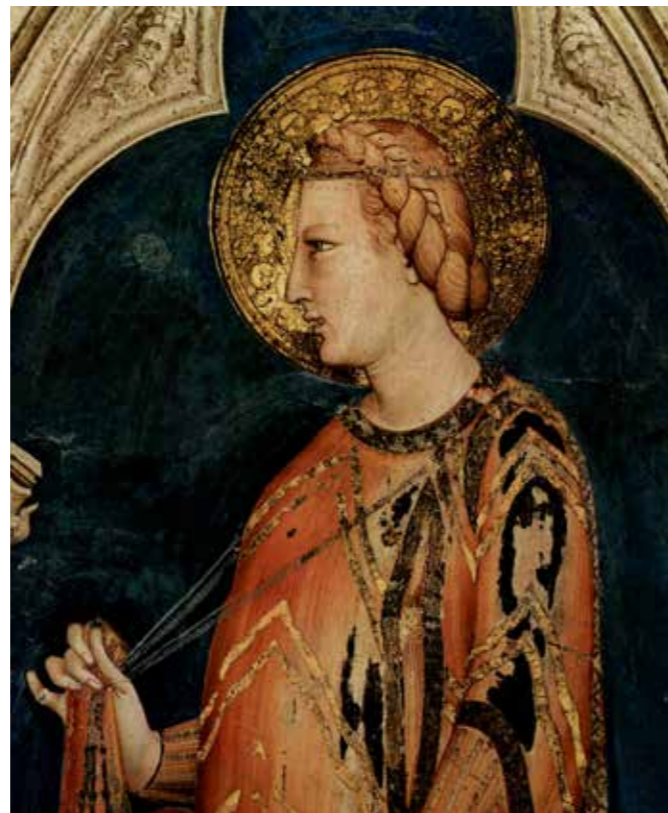
图 1：匈牙利王后伊丽莎白的画像 (Elisabeth of Hungary) 23

力，这一动力是巨大的，古今中外，概莫能外。这位王后不但每天在皮肤上擦拭这种护肤水，而且还时不时喝下它，希望由内而外得到新生。还好，老修士所言不虚，这位王后果然保持了姣好的面容和皮肤，喝下去的护肤水也未变成毒药。传说，这位王后 70 多岁高龄时依然皮肤紧致、身材苗条，甚至还迷倒了波兰国王、成了波兰王后，管理了波兰。这种神奇的护肤水就以“匈牙利王后水”的名字在欧洲传开了，成为全欧洲王公贵族追捧的稀罕之物，以至于法国国王查理五世把匈牙利王后水带到了法国。