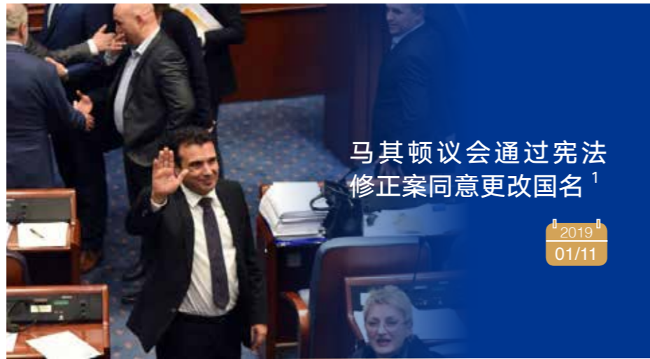
图 1：马其顿总理扎埃夫在议会投票结果公布后向记者示意

“读图”板块精选过去几周中东欧国家发生的时事新闻等信息，以图片或图表为主、文字为辅的形式进行展现，例如最新政治动态、经济增长数据、社会最新动态、与中国往来的最新事件，等等。