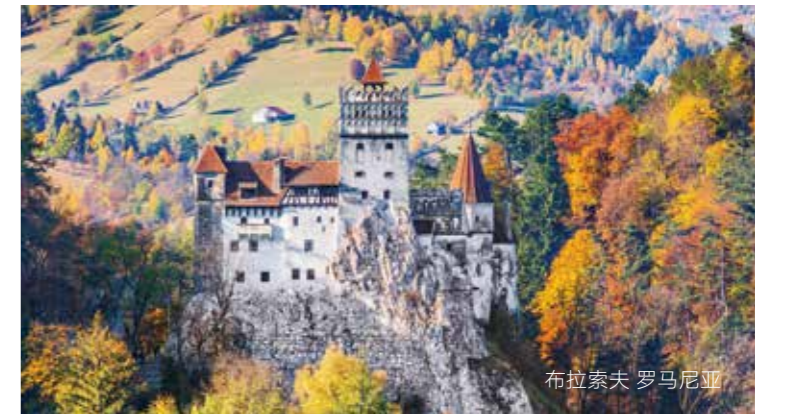
布拉索夫 罗马尼亚