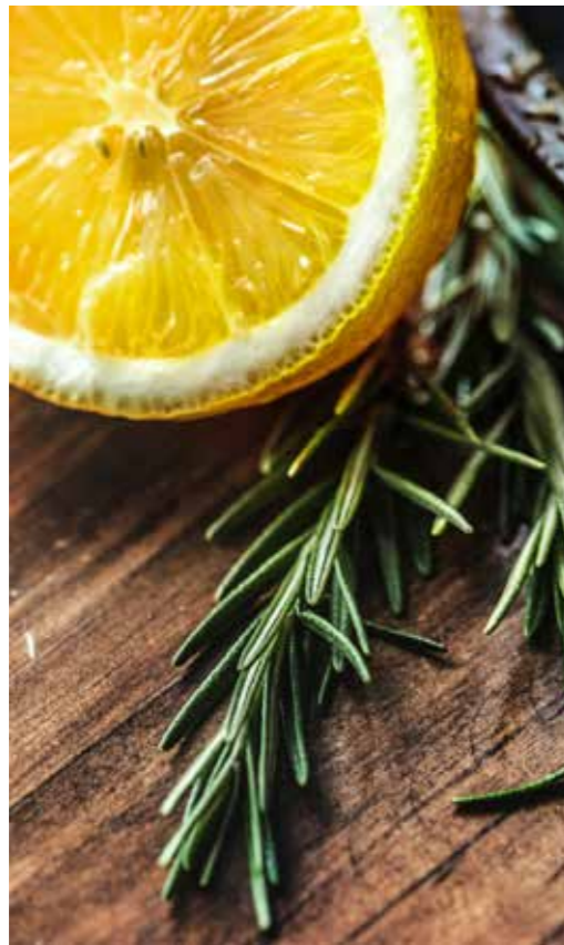
图 3：迷迭香和橙子 27

迷迭香原产于地中海地区，它其实还有一个更美的名字，叫做“海中之露”，因为它最早被发现生长在地中海沿岸的断崖上，只需要很少的露水就能存活。其实，在现代西餐烹饪中，迷迭香是一味调料，在主菜甚至甜点中均可用：