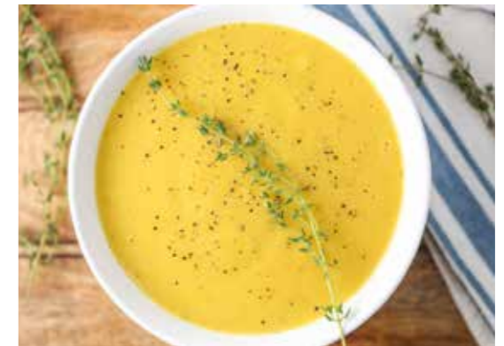
图 7：含有百里香的汤 32

在匈牙利王后水里，迷迭香拥有能令人头脑清醒的香味，它的精油能舒缓皮肤的紧皱 33 ；百里香的香气浓郁，它的精油具有一定杀菌功能 34 ；酒精是将这些成份混合在一起的溶剂。其实，用现代观点来看，匈牙利王后水的最原始成份，是一种具有一定消炎功能的芳香水。由于它的成份都是可以食用的，所以只要不过量，就可以改善身体机能。这恐怕就是伊丽莎白王太后能活到 75 岁的原因吧！