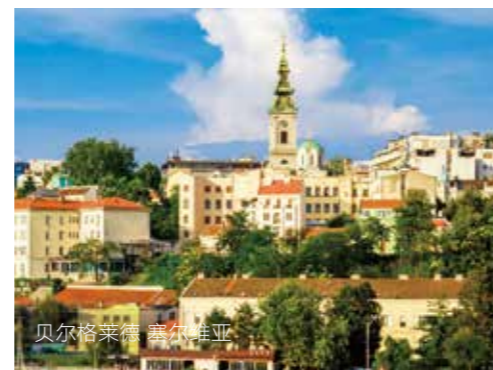
贝尔格莱德 塞尔维亚