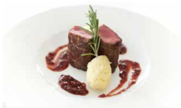
图 4：使用迷迭香的西餐主菜 28