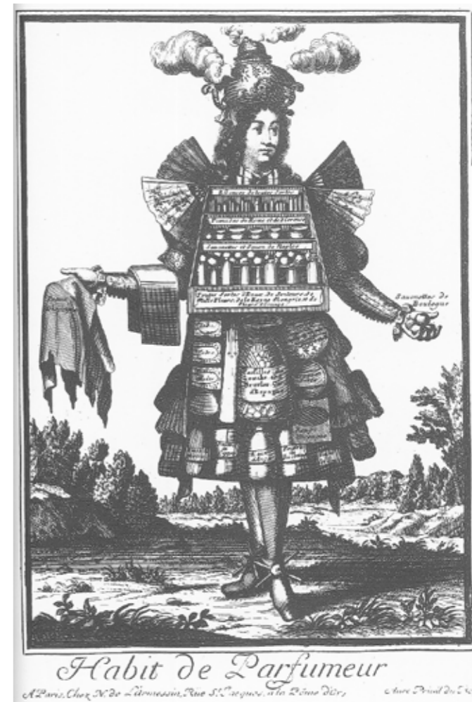
图 2：17 世纪时法国兜售香水小贩的画像 24

伊丽莎白王后 (Elisabeth of Hungary) 是匈牙利历史上最有名的国王拉约什大王的母亲。在上面的传说中，难免有些夸张，不过，有一些信息是符合历史逻辑或历史事实的，比如：①匈牙利王后水来自一位“老修士”；②伊丽莎白王后管理过波兰；③匈牙利王后水确实可以喝。其他的信息都不准确。