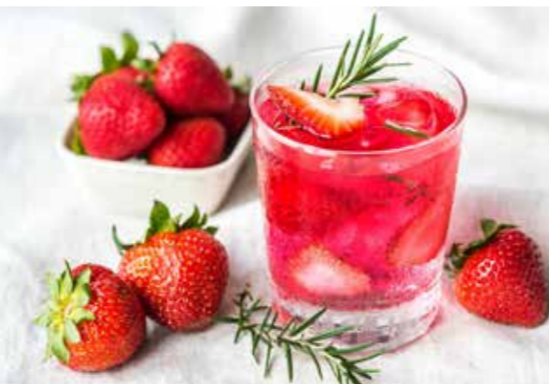
图 5：使用迷迭香的西餐甜点 29

至于麝香草，它其实也有一个别名，叫百里香。关于它的来历，有一种很凄美的传说：特洛伊的海伦 (Helen of Troy) 因为看见特洛伊战争的残忍而忍不住落泪，她的泪珠溅到地上，就变成了百里香的小叶子 30 。现在，百里香也是西餐里很常用的一味调料了，新鲜的百里香是这样的：