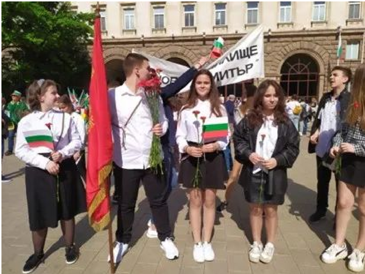
圣西里尔和圣美多德日庆祝活动 (2)