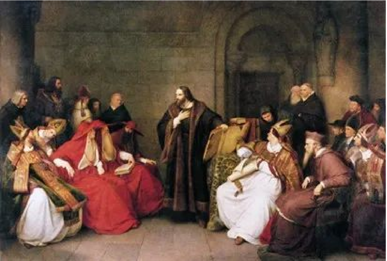
扬·胡斯在康斯坦茨宗教公会上 [4]

当时教会以火刑方式处死异端并不希罕，但是胡斯的惨死和殉道，引发了当时波西米亚王国、如今捷克国内民众的愤怒和反抗，成为引爆胡斯信徒开展武装抗争的思想起点。从1419年开始，捷克民族开展了长达15年、针对天主教会和神圣罗马帝国的武装斗争，史称“胡斯战争”或“波希米亚战争”，也被称为捷克民族争取宗教自由和民族独立运动的一座高峰，至今仍然是捷克人民坚持独立、自由等价值观的思想源泉之一。如今，在布拉格的老城广场矗立着醒目的胡斯雕像，供人凭吊，他逝世的7月6日被称为胡斯日，也是捷克的公共假日。