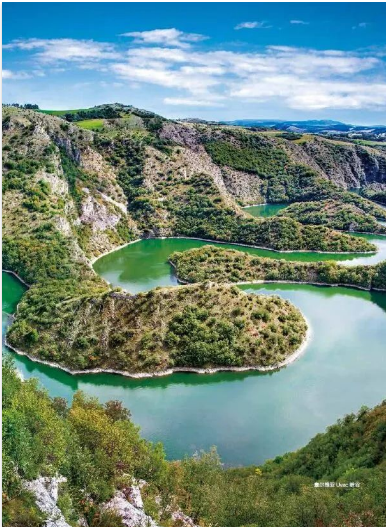
塞尔维亚 Uvac 峡谷