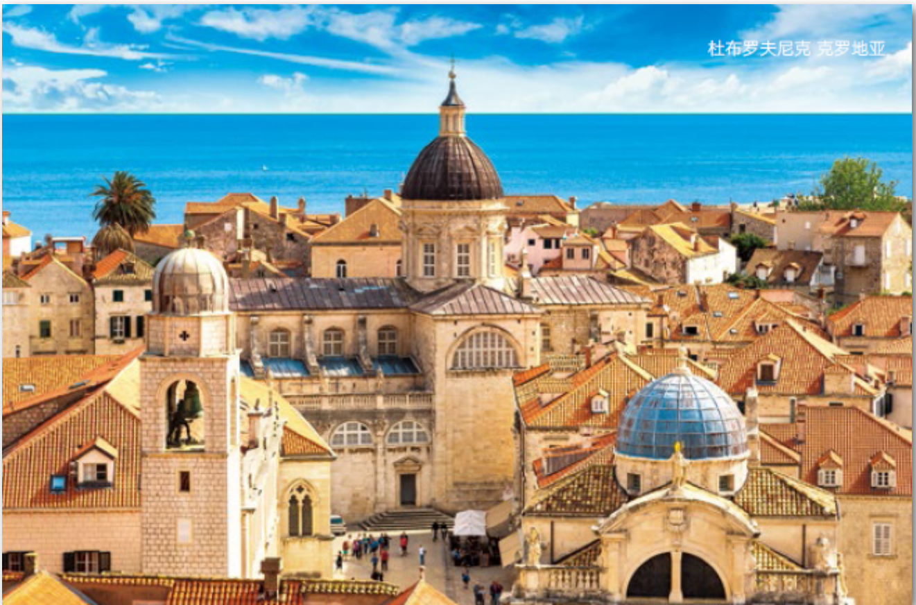
杜布罗夫尼克 克罗地亚

https://www.intellinews.com/bnegr-green-croatia-has-potential-offshore-wind-capacity-of-up-to-25-gw-278380/?source=croatia