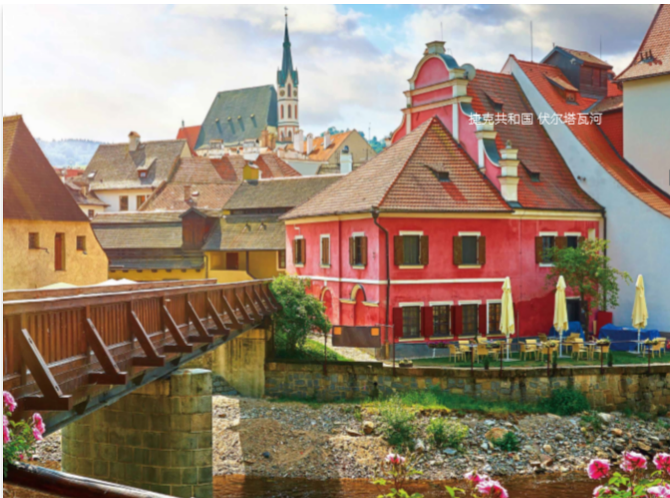
- 捷克 伏尔塔瓦河 -

本刊物旨在为读者提供关于中东欧国家及相关国家最新的多样化资讯，所摘译文章不代表本刊物观点。部分文章标题有改动。