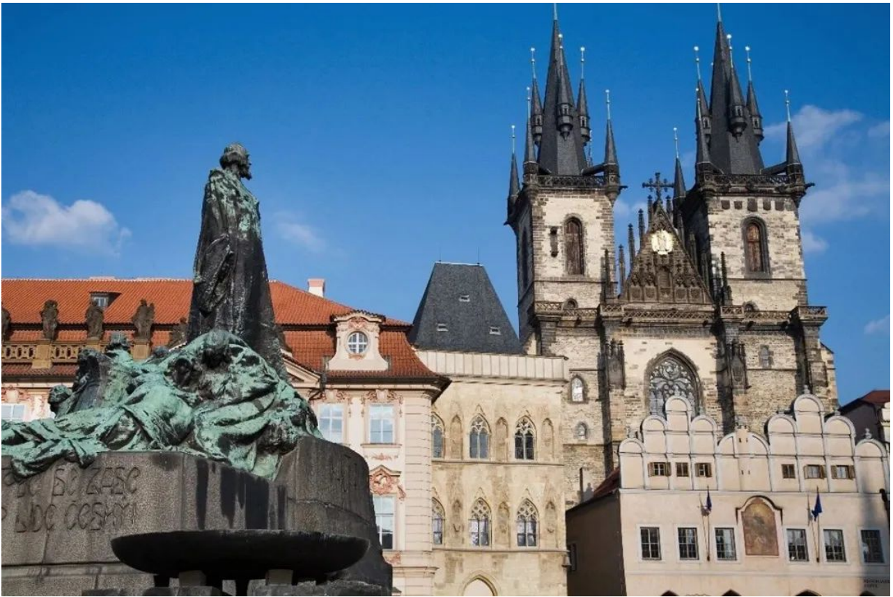
布拉格老城广场上的胡斯纪念碑 [5]

1999年，罗马天主教会为胡斯处以火刑正式道歉。五百多年过去了，天主教会终于还给胡斯、还给捷克的胡斯信徒、还给全世界的天主教徒一个公道。