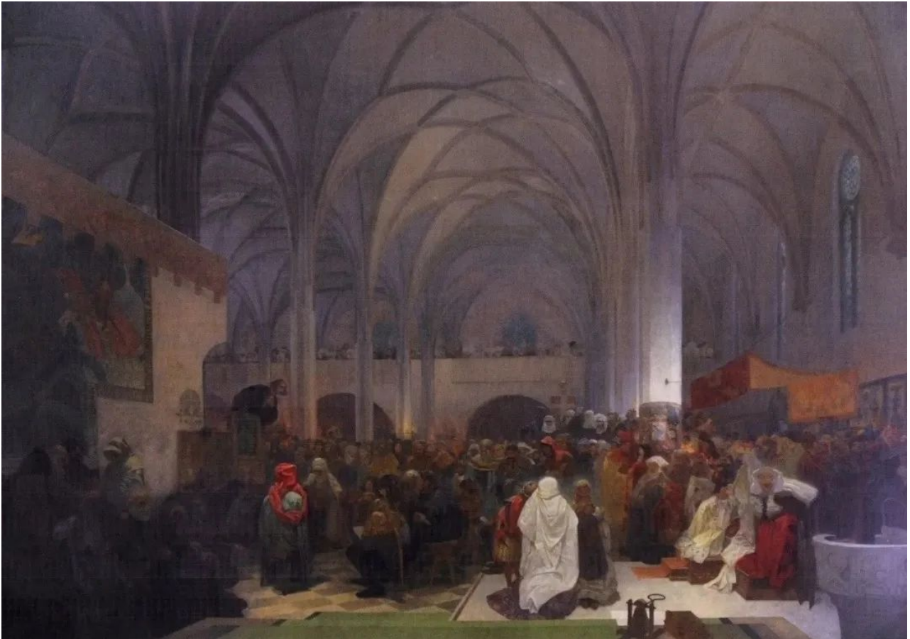
捷克国宝级画家穆夏《斯拉夫史诗》中关于胡斯传教的画作 [3]

正是在这样的背景下，扬·胡斯对上述问题进行了公开而尖锐的批评，并提出了宗教改革主张。胡斯虽然出身于捷克的一个普通农民家庭，但幼年时期即显露了不凡的天赋和对学习的酷爱，这促使他的家人支持他接受更好的教育。大约23岁时，胡斯获得布拉格查理大学学士学位，26岁获得硕士学位，而后留校任教，那是罗马帝国皇帝查理四世创建的中欧第一所大学。1409年，39岁的胡斯，成为查理大学校长。