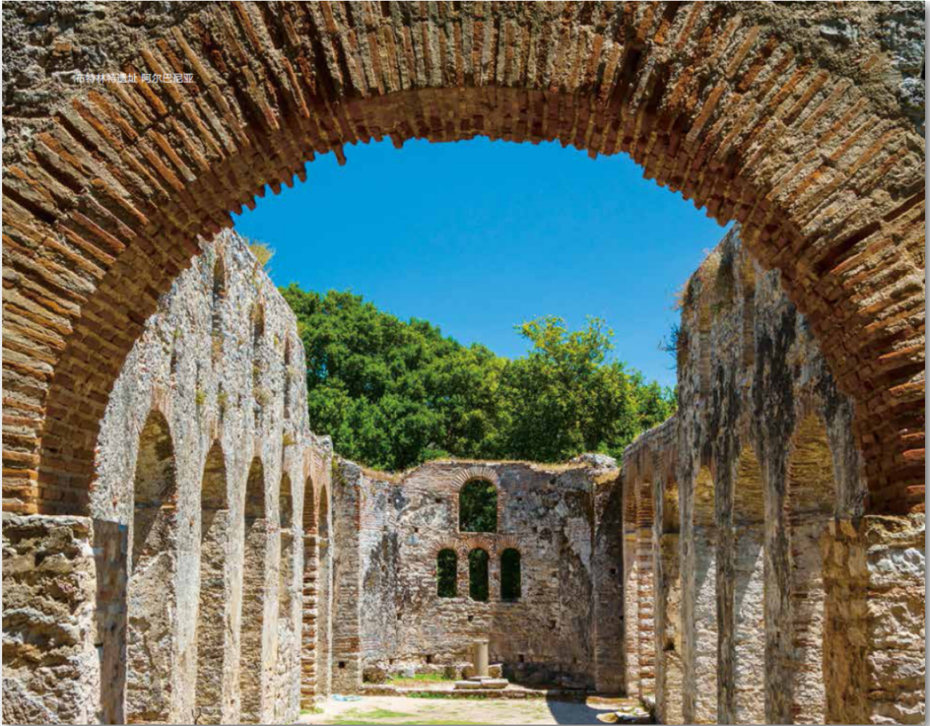
布特林特遗址 阿尔巴尼亚