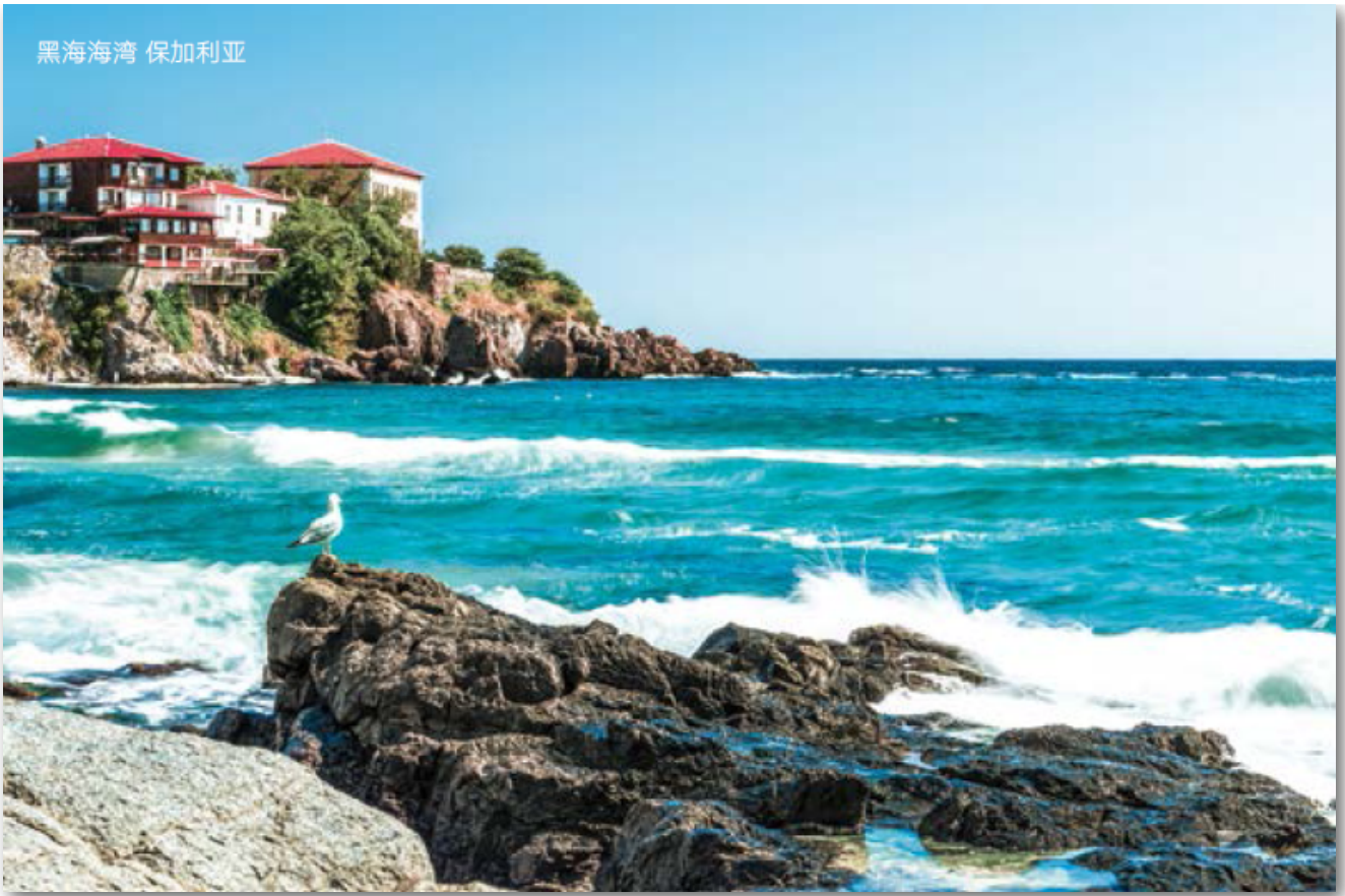
黑海海湾 保加利亚