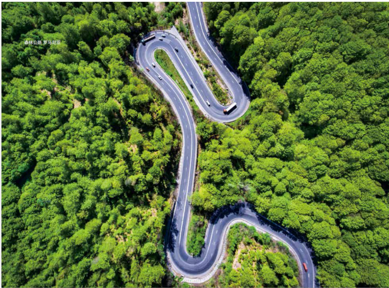
森林公路 罗马尼亚