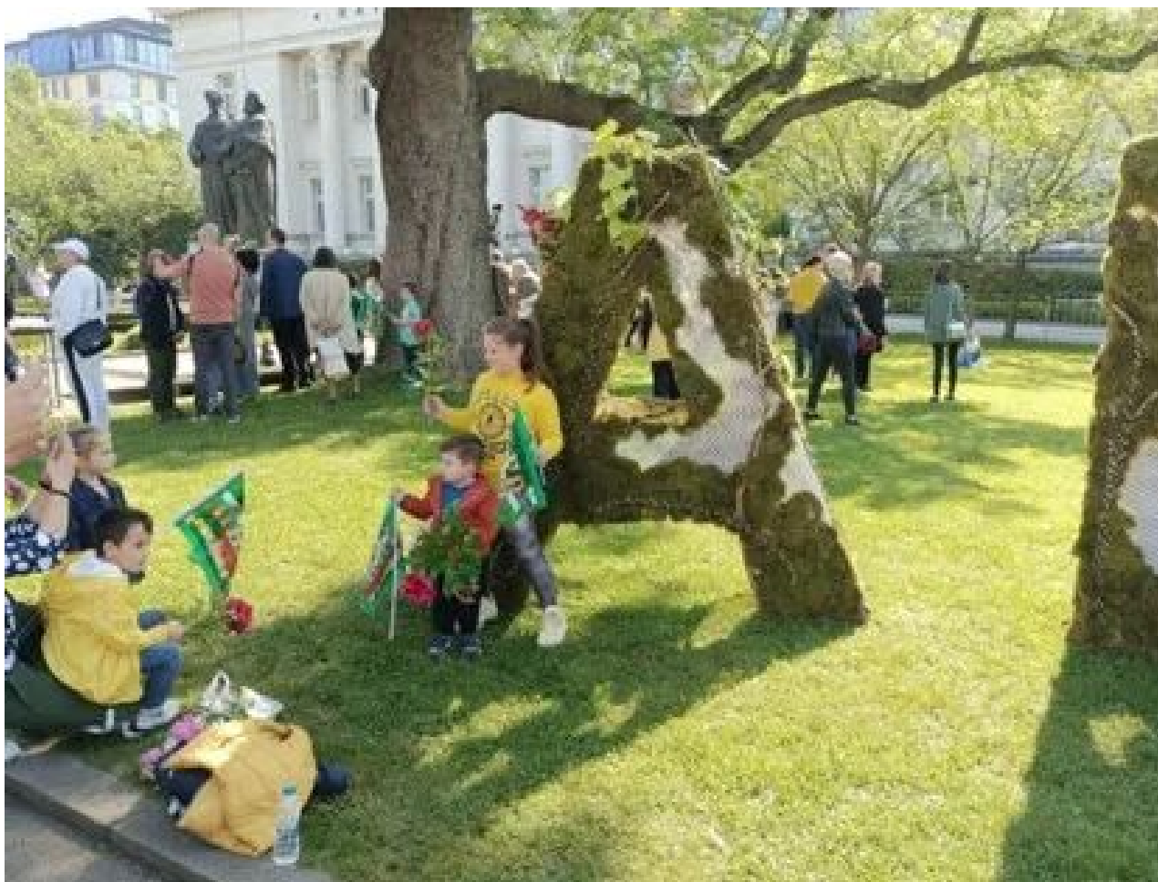
圣西里尔和圣美多德日庆祝活动 (3)