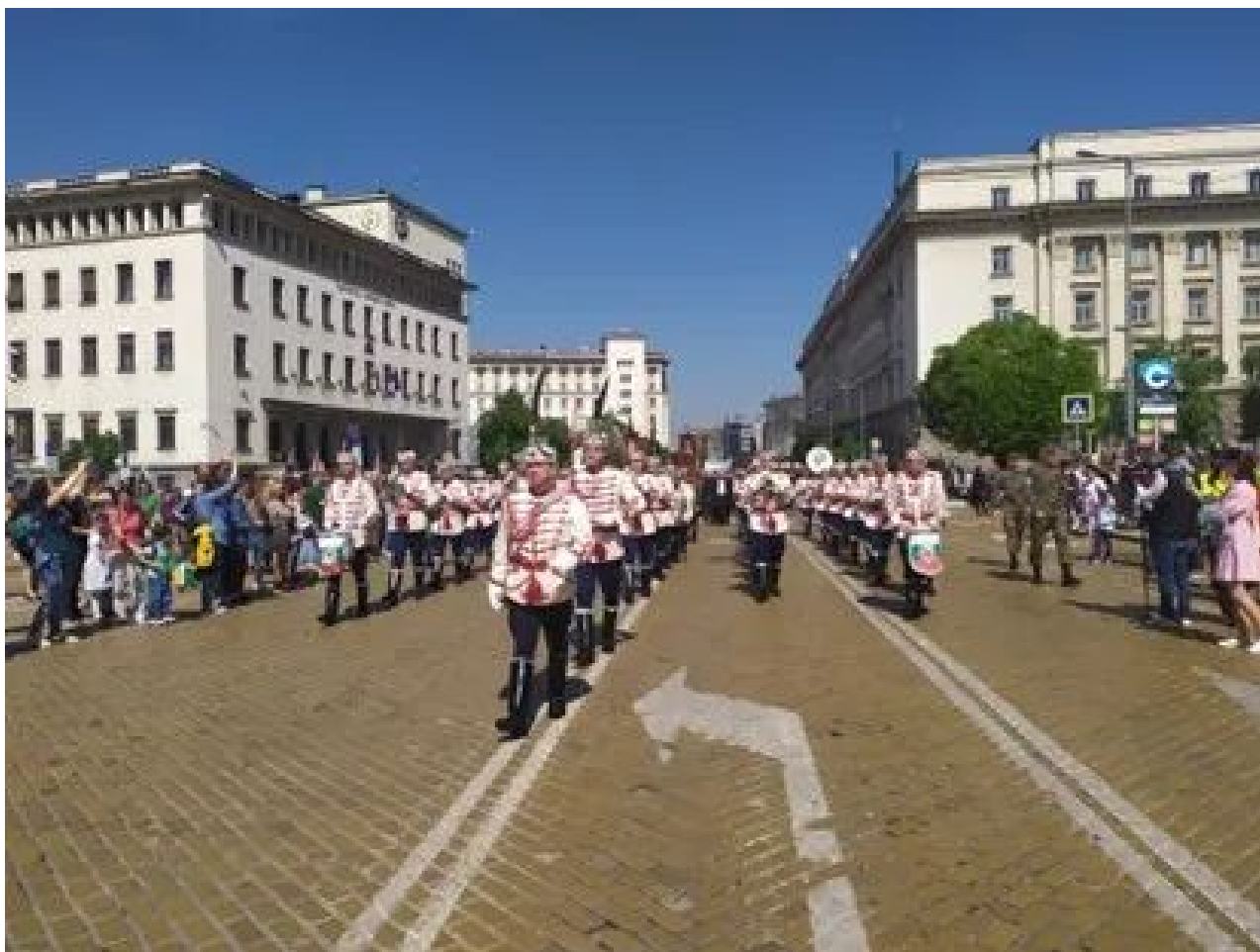
圣西里尔和圣美多德日庆祝活动 (1)