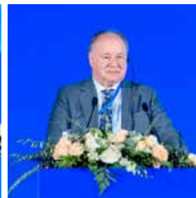
中欧国际工商学院欧方院长、市场营销学教授杜道明 (Dominique Turpin)