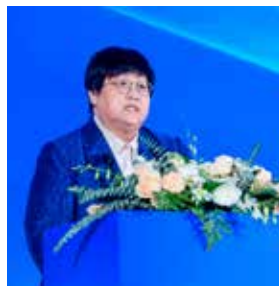
中欧国际工商学院院长、管理学教授汪泓